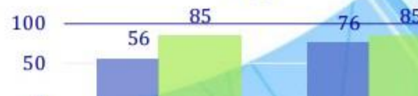
Количество субъектов РФ, в которых образованы органы ТОС

Максимальное количество органов ТОС в Краснодарском крае: • 5 992 органов ТОС