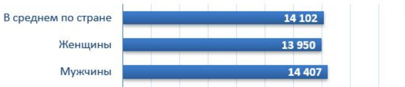
Размер пенсий у разных категорий пенсионеров в 2019 году, рублей

Разделение благосостояния мужчин и женщин в следствии разного возраста ухода на пенсию.