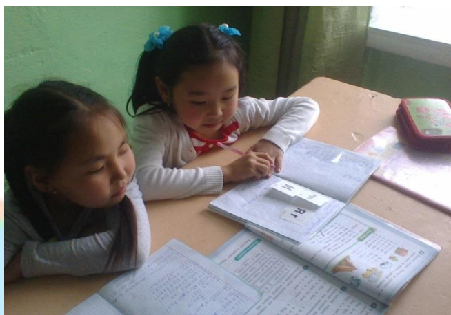
"Что ты рисуешь?"