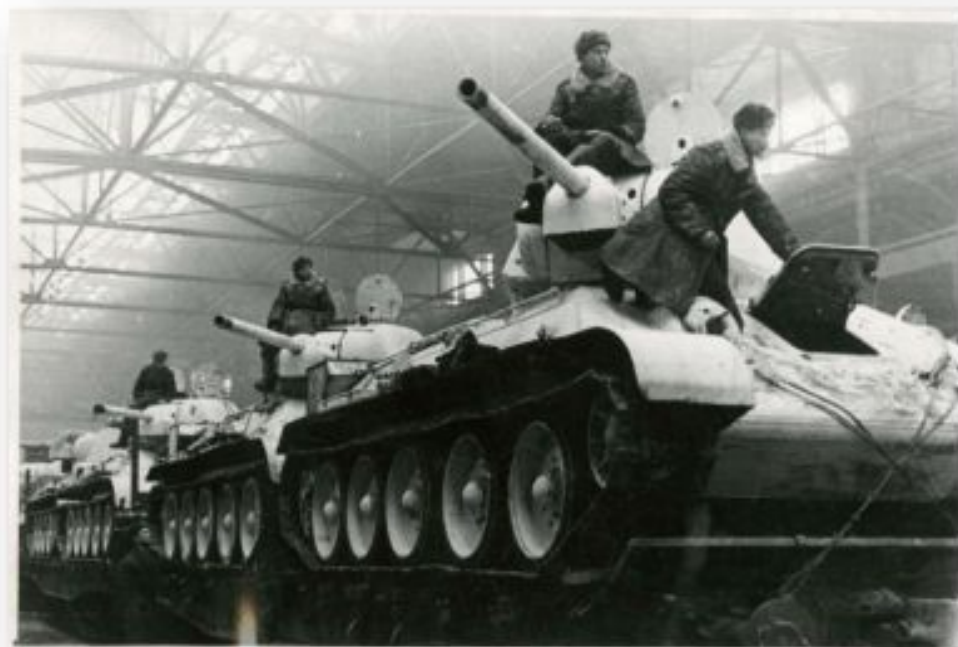
T-34 на жд-платформах