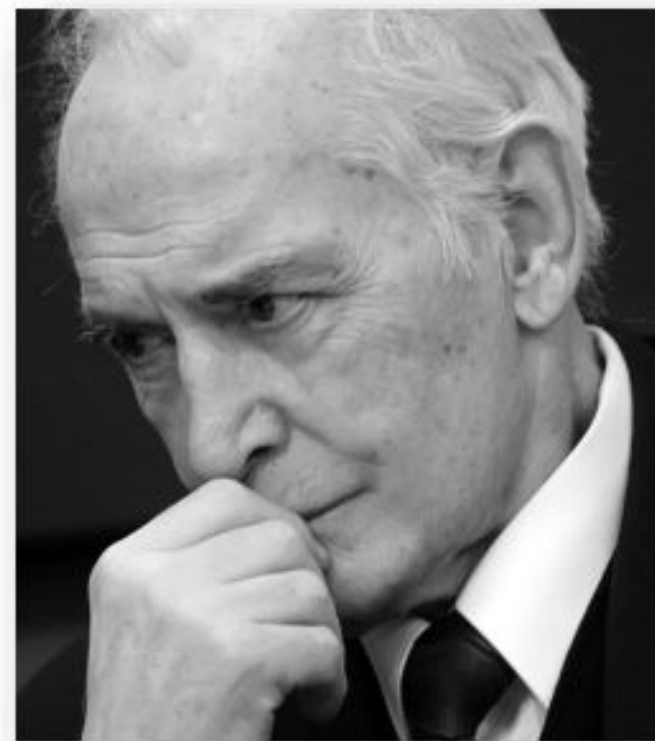
Лановой Василий Семенович