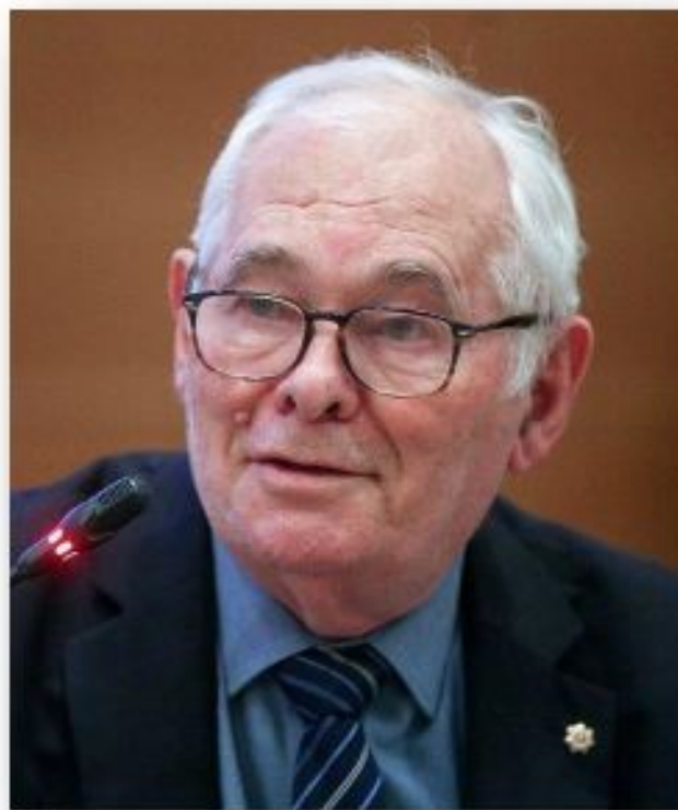
Рошаль Леонид Михайлович