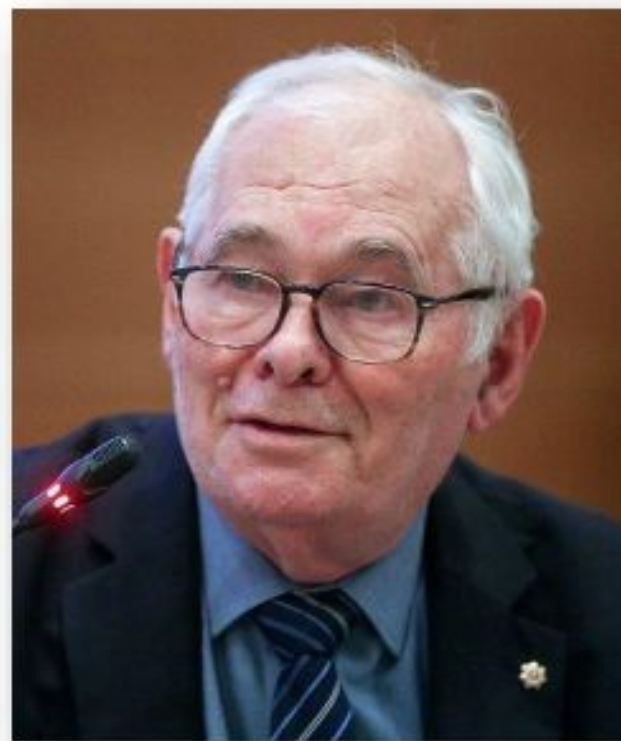
Рошаль Леонид Михайлович