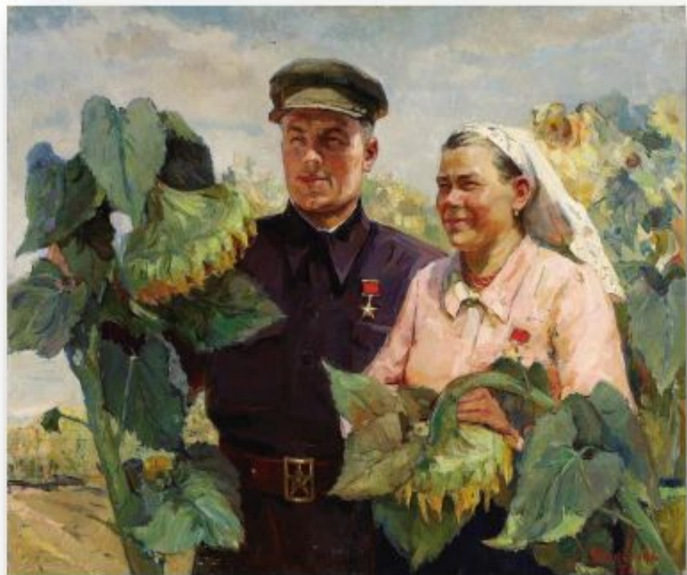
«Герои Социалистического труда». 1951 г.

К началу 1977 года звание Героя Социалистического Труда было присвоено 18 287 советским гражданам , из которых свыше ста человек награждены двумя медалями «Серп и Молот».