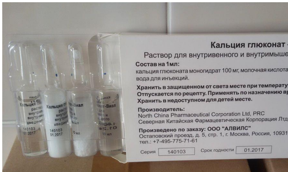
Осадок в инъекционном растворе