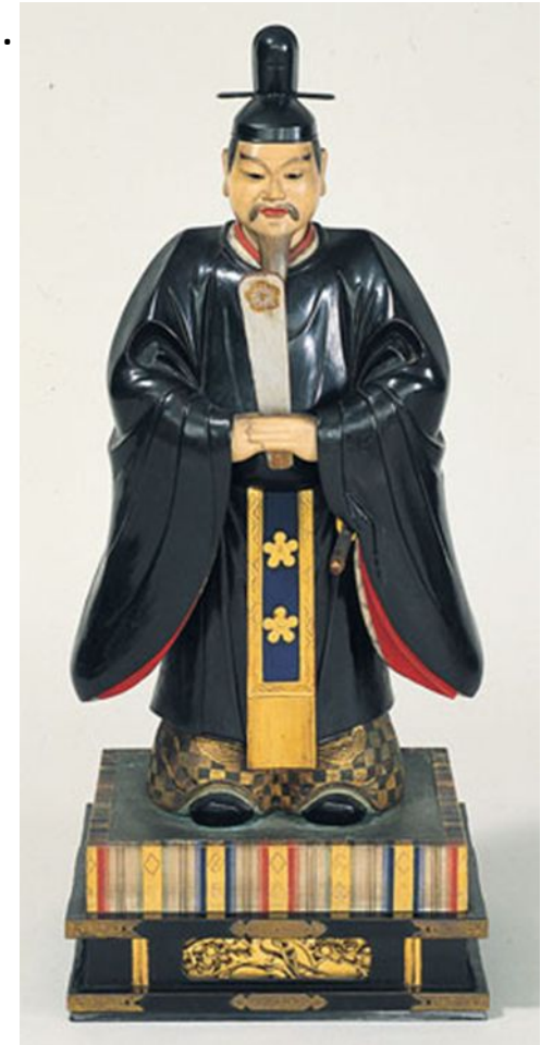
Сугавара Митидзанэ. Период Эдо