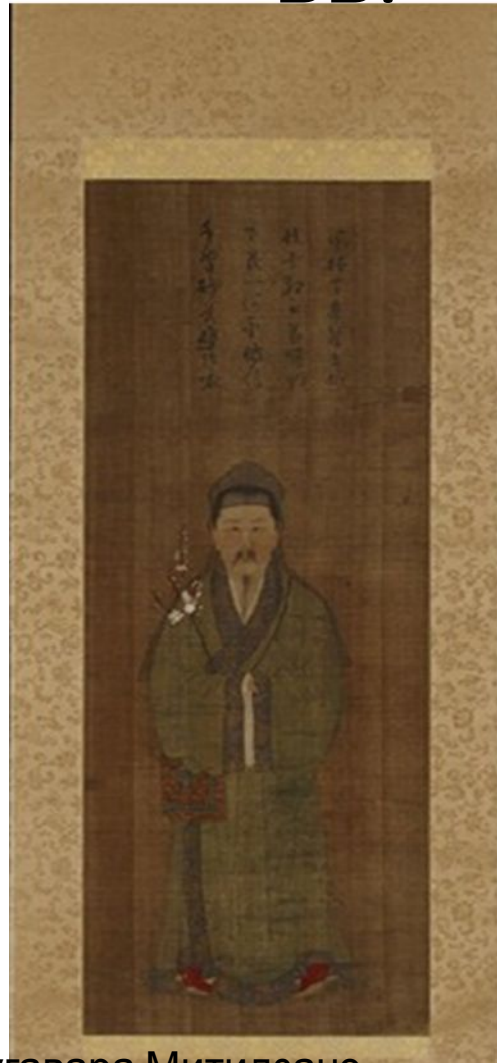
Сугавара Митидзанэ. Неизвестный художник. Конец XV в.

Воплощение бодхисаттвы Каннон (божества милосердия)