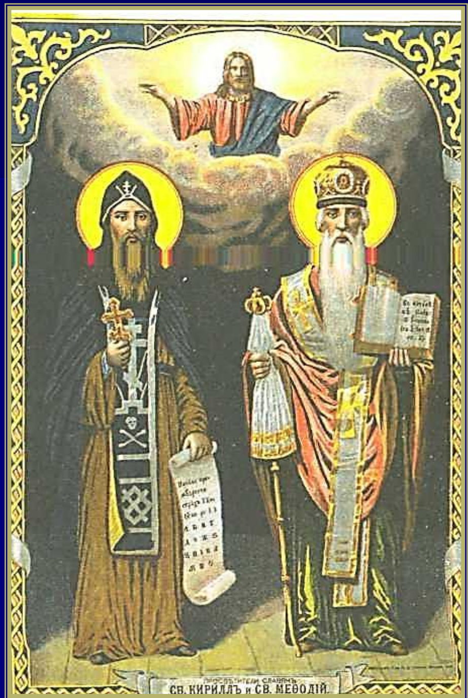
Кирилл и Мефодий. Хромофотография. 1914 г.

ПРОСВЕТИТЕЛИ СЛАВЯНЪ СВ. КИРИЛЪ и СВ. МЕФОДИЙ