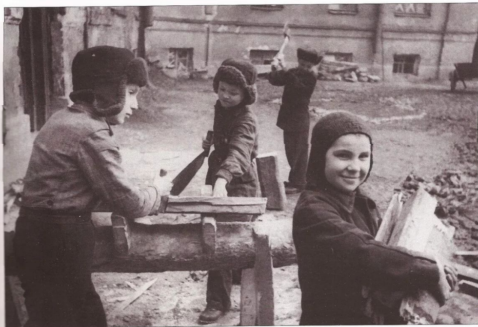
Ребята-тимуровцы за работой. [1941–1944 гг.], Ленинград.