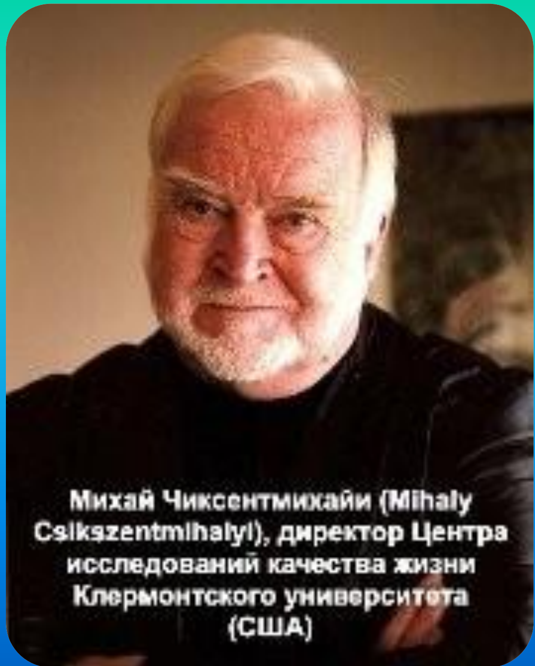
Михай Чиксентмихайи (Mihaly Csikszentmihalyi), директор Центра исследований качества жизни Клермонтского университета (США)

Михай Чиксентмихайи - человек, одержимый счастьем.