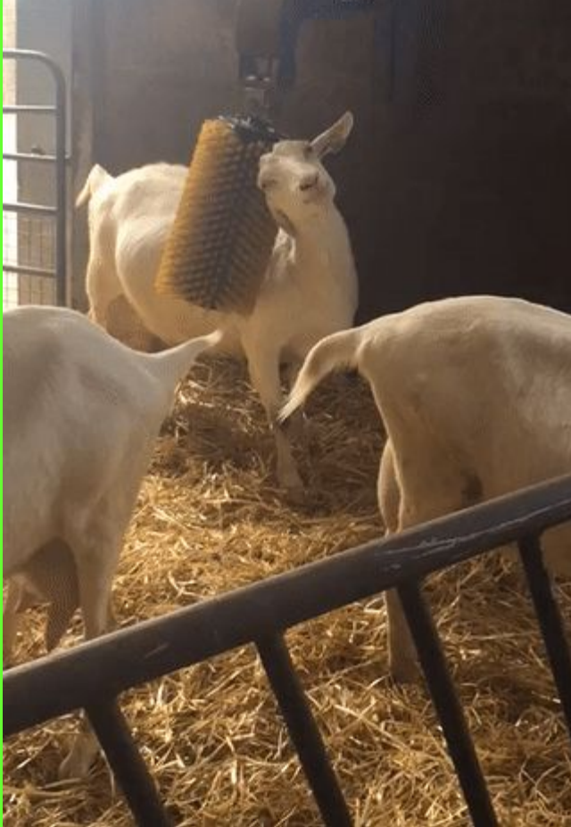
Автоматическая щётка- чесалка