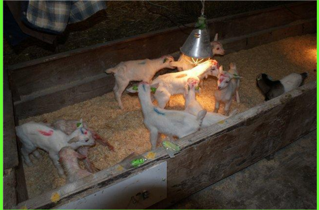
Лампа для обогрева козлят