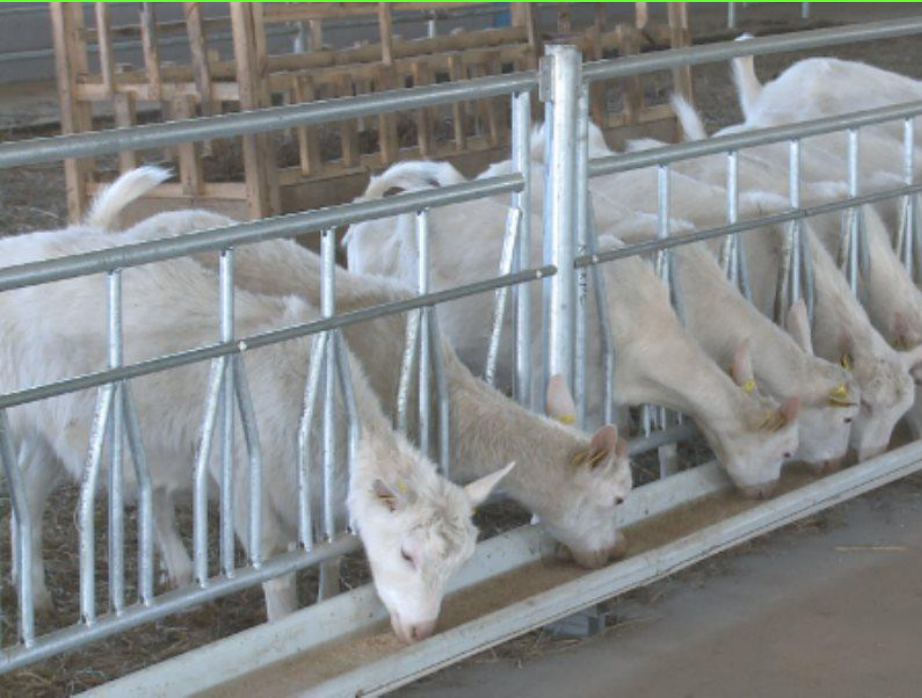
Кормушка-труба для концентратов