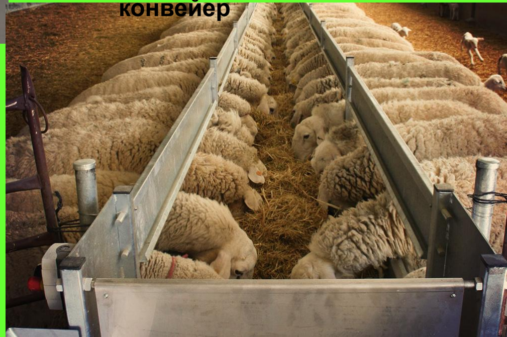
Комовая лента или конвейер