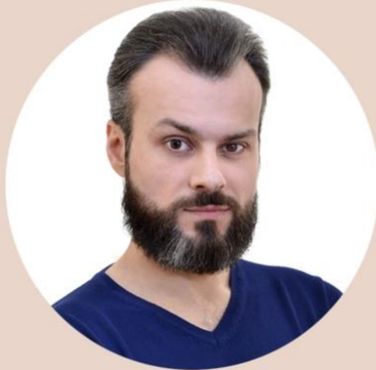
ДМИТРИЙ ФЕДОРОВ народный артист ДНР

ДОНЕЦКИЙ ГОСУДАРСТВЕННЫЙ АКАДЕМИЧЕСКИЙ МУЗЫКАЛЬНО-ДРАМАТИЧЕСКИЙ ТЕАТР ИМЕНИ М.М. БРОВУНА