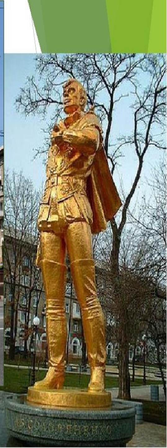
Донецкий государственный академический театр оперы и балета им. А.Б. Соловьяненко