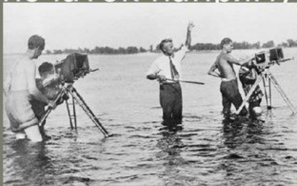
Довженко на зйомках фільму, 1932 р.