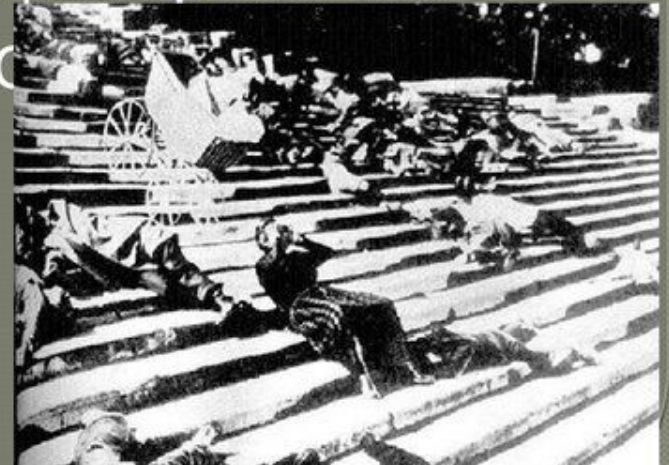
Кадри з фільму «Броненосець Потьомкін»