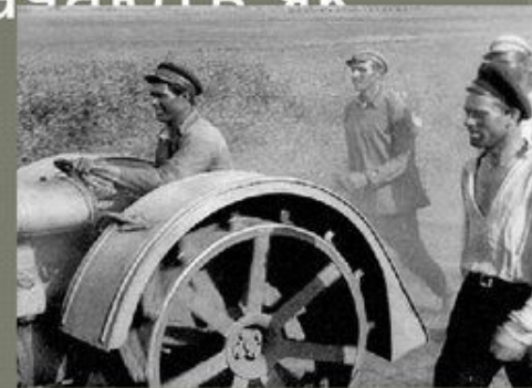
Кадри с фільму «Земля»