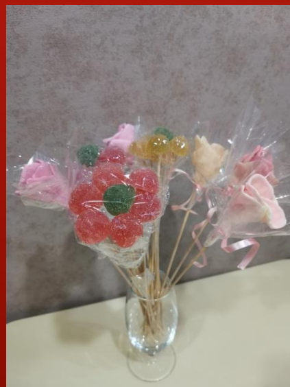
Из цветов собрала букет. Можно пить чай!