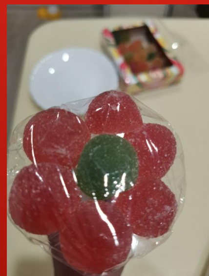
Собрала цеток и упаковала его в слюду