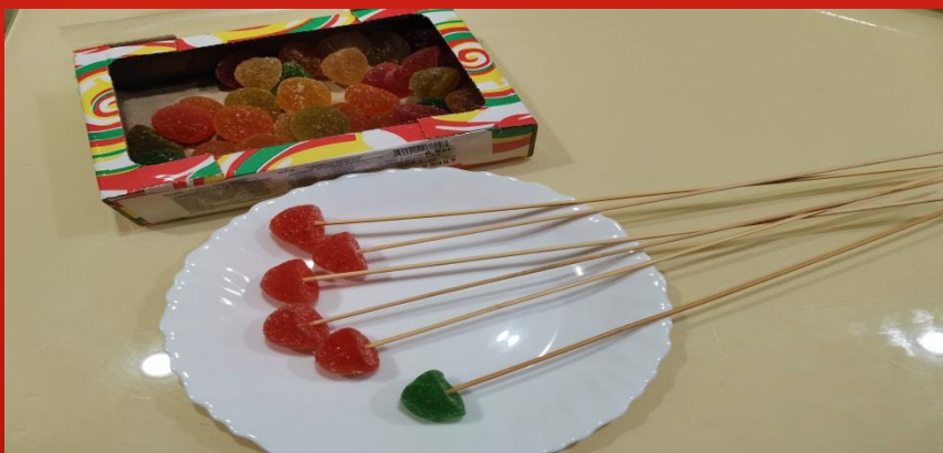
Я подготовила мармелад