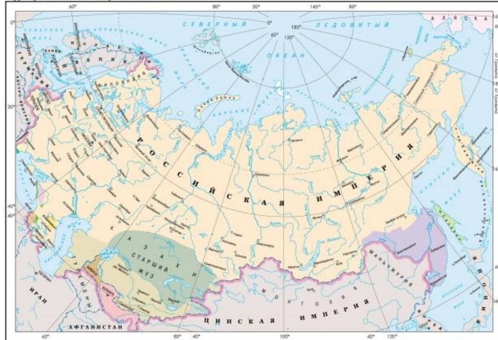
Территория Российской империи в 1815-1878 гг.