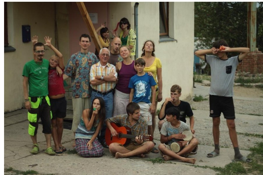
Коммуна «ЭкоЛофт на Пятницкой», Мск, 2010