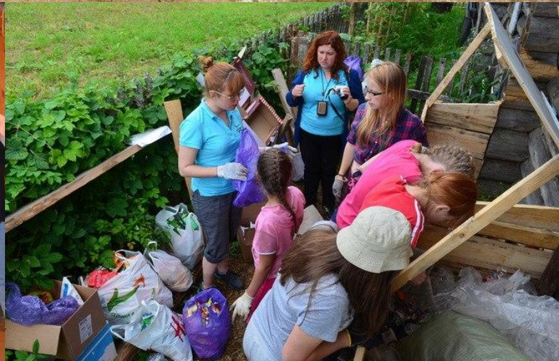
д. Верхний Березник (или д. Тарасовская) Устьянского района Архангельской области https://vk.com/village_alive