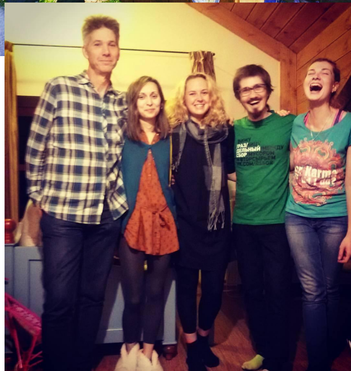
Фриланс-Отель эко/зож/вег Красная Поляна, Сочи, 2015