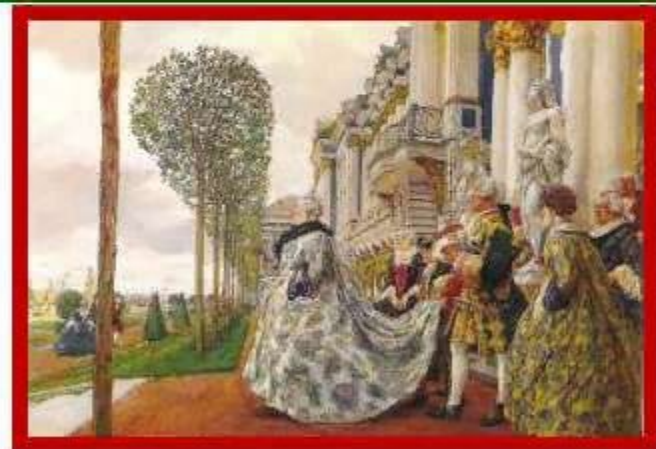
Императрица Елизавета Петровна в Царском Селе Е. Е. Лансере