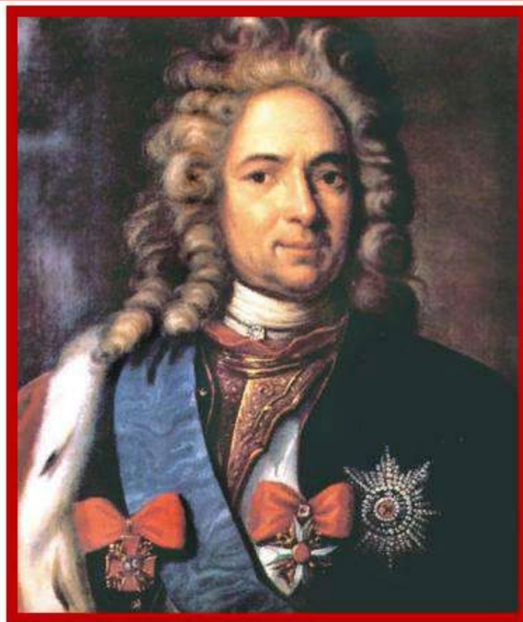
Александр Данилович Меншиков