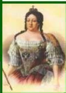
Анна Иоанновна 1730-1740