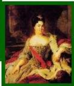
Екатерина I 1725-1727