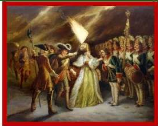
Филипп М.Р. Присяга преображенцев дочери Петра Великого.