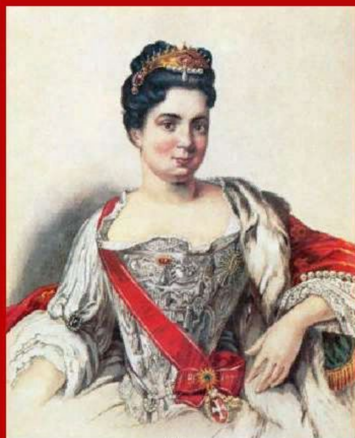
Екатерина I Алексеевна. (1684-1727)