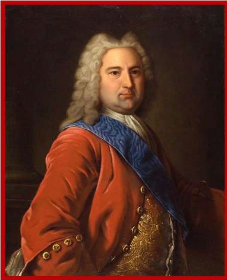
Эрнст Бирон – фаворит Анны Иоанновны