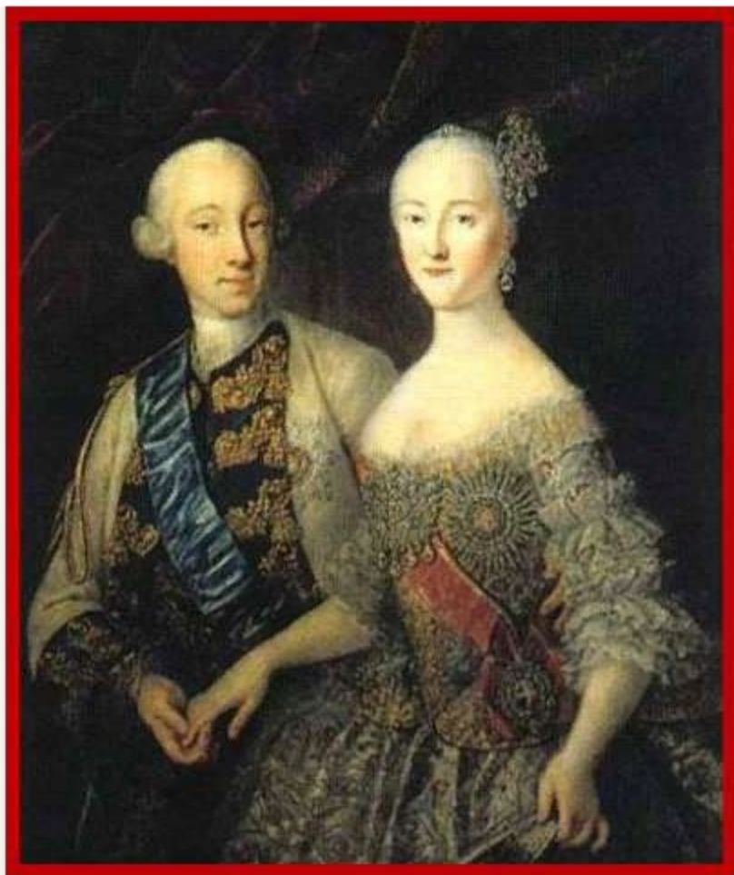
Петр Федорович, великий князь, Екатерина Алексеевна, великая княгиня.