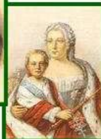
Иван VI Антонович и Анна Леопольдовна 1740-1741