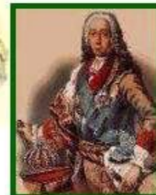
Петр III 1761-1762