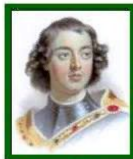
Петр I 1682-1725

Период в истории России с 1725 по 1762 гг.