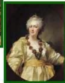
Екатерина II 1762-1796