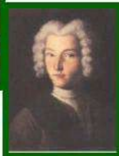
Петр II 1727-1730