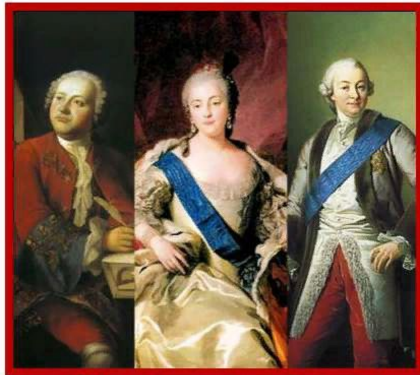
Михаил Васильевич Ломоносов, императрица Елизавета Петровна, Иван Иванович Шувалов.