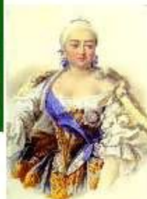
Елизавета Петровна 1741-1761