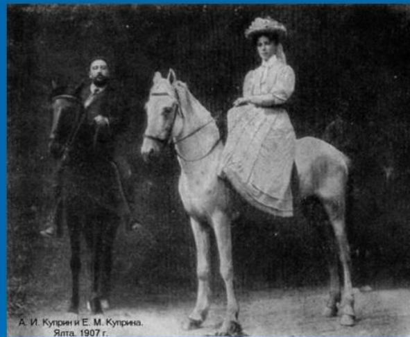
А. И. Куприн и Е. М. Куприна. Ялта. 1907 г.