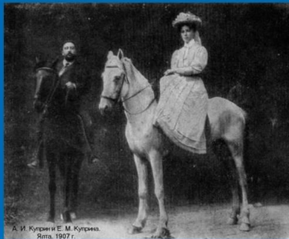
А. И. Куприн и Е. М. Куприна. Ялта. 1907 г.