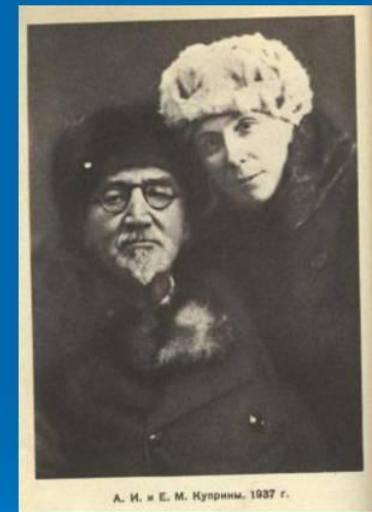
А. И. и Е. М. Куприны. 1937 г.