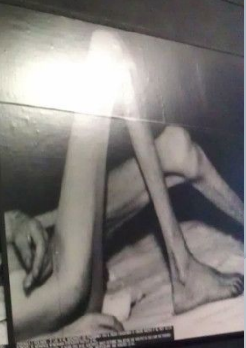
POLKA - 31 LAT, W AL. AUSCHWITZ OD MAJA 1941 R. PRZED OSADZENIEM W OBOJZE WAZYLA OK. 75 KG, PLECY 86 CM WZROSTU. W MOMENCIE WYFOTOWANIA FOTOGRAFII WAZYLA 23 KG. POLISH WOMAN - 31 YEARS OLD, IN AL. AUSCHWITZ, SINCE MAY 1941, BEFORE SHE WAS PUT IN THE CAMP SHE WEIGHED APPROX. 75 KG AND WAS 181 CM TALL. AT THE MOMENT OF TAKING THIS PHOTOGRAPH SHE WEIGHED 23 KG.