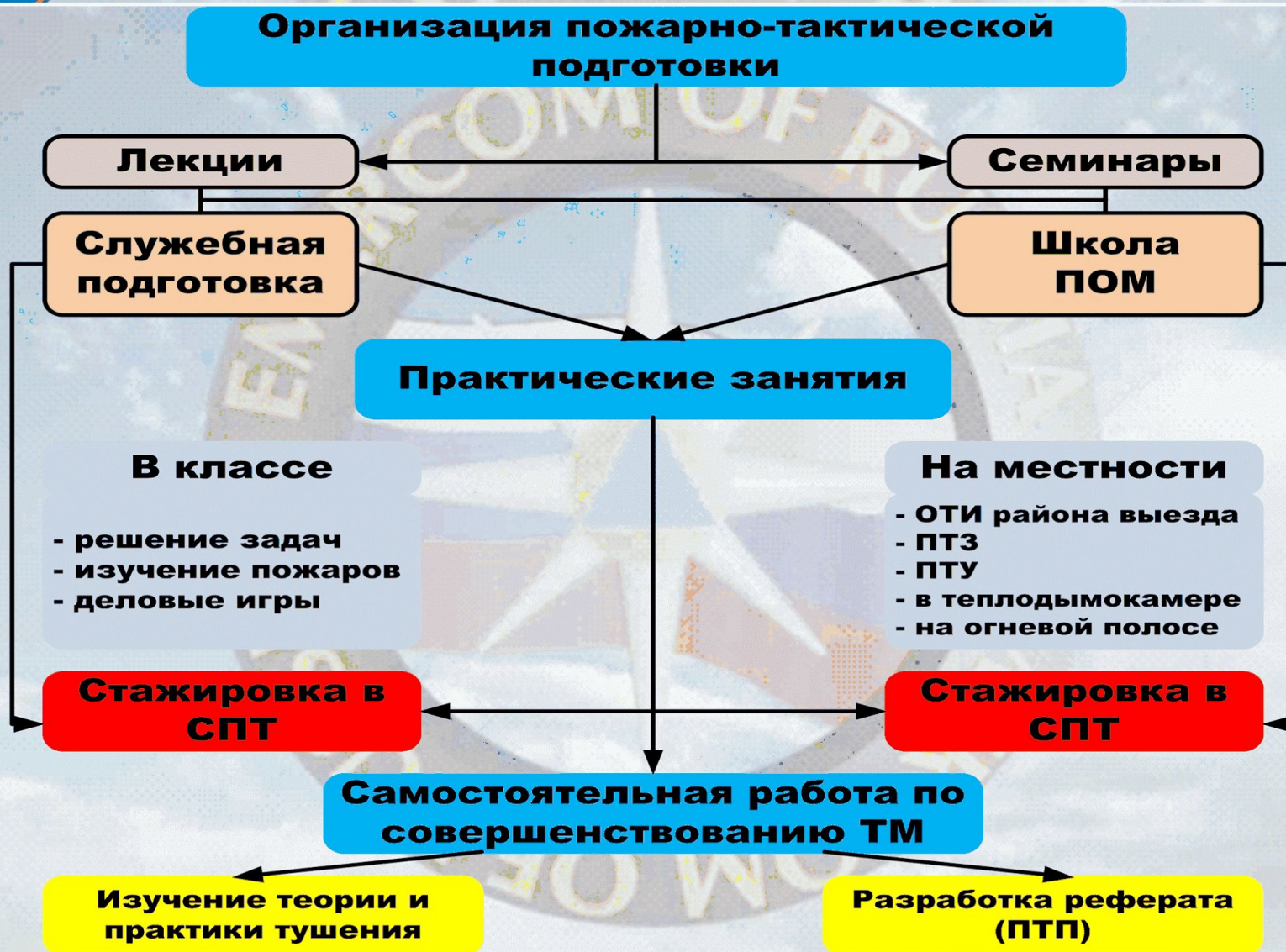
Схема тактической подготовки