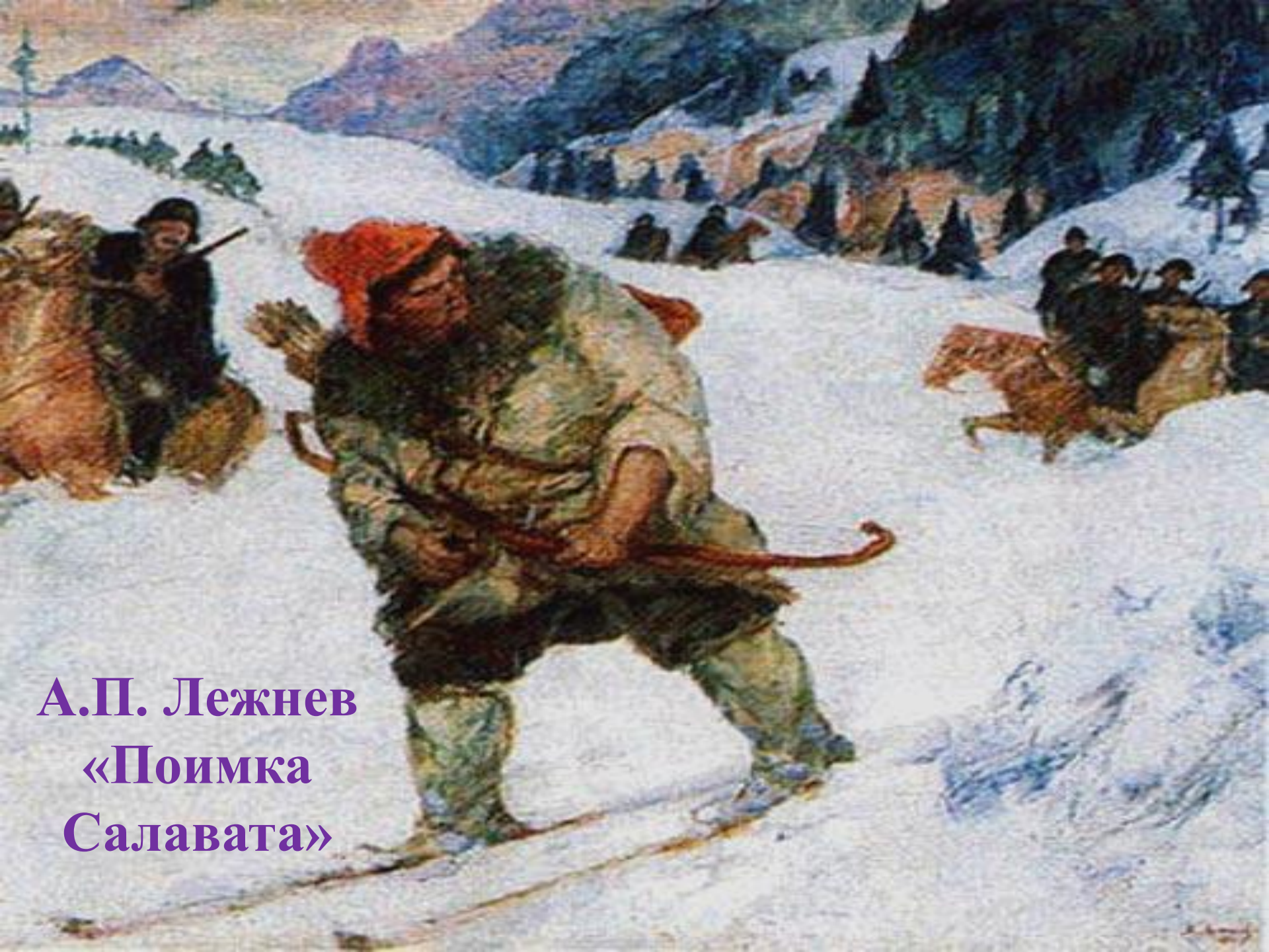
А.П. Лежнев «Поимка Салавата»