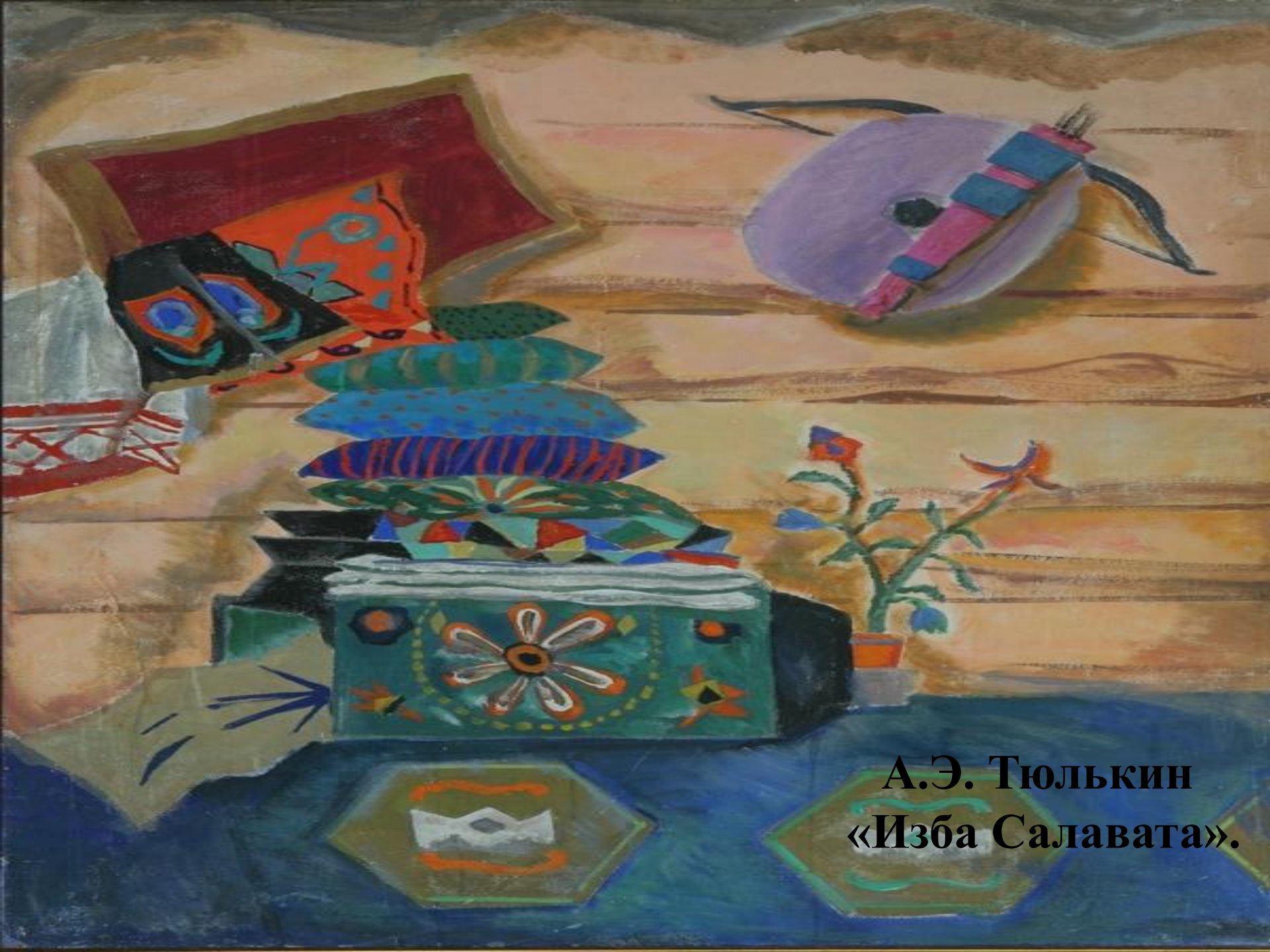
А.Э. Тюлькин «Изба Салавата».