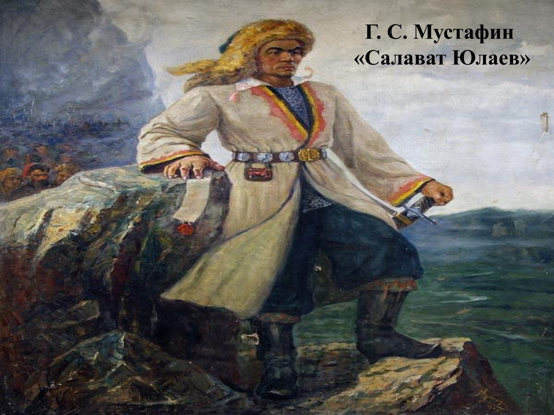
Г. С. Мустафин «Салават Юлаев»