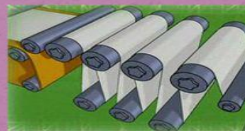
Отжим воды, сушка, полирование