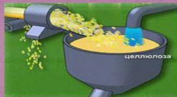
Варят измельченные щепки