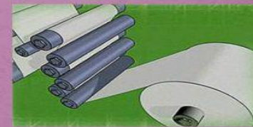
Намотка в рулон