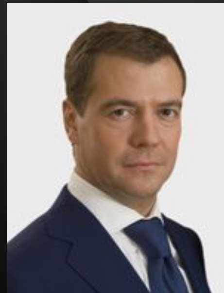
Д.А.Медведев Третий Президент РФ март 2008 – май 2012 гг.

Четвертый вступил в должность 7 мая 2012 г.