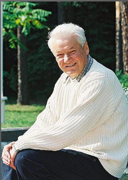
Б.Н.Ельцин Первый Президент РФ июнь 1991- декабрь 1999 гг.