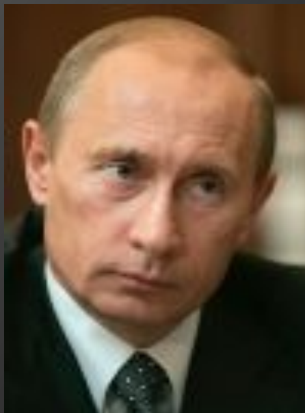
В.В.Путин Второй Президент РФ март 2000- май 2008 гг.;

Четвертый вступил в должность 7 мая 2012 г.