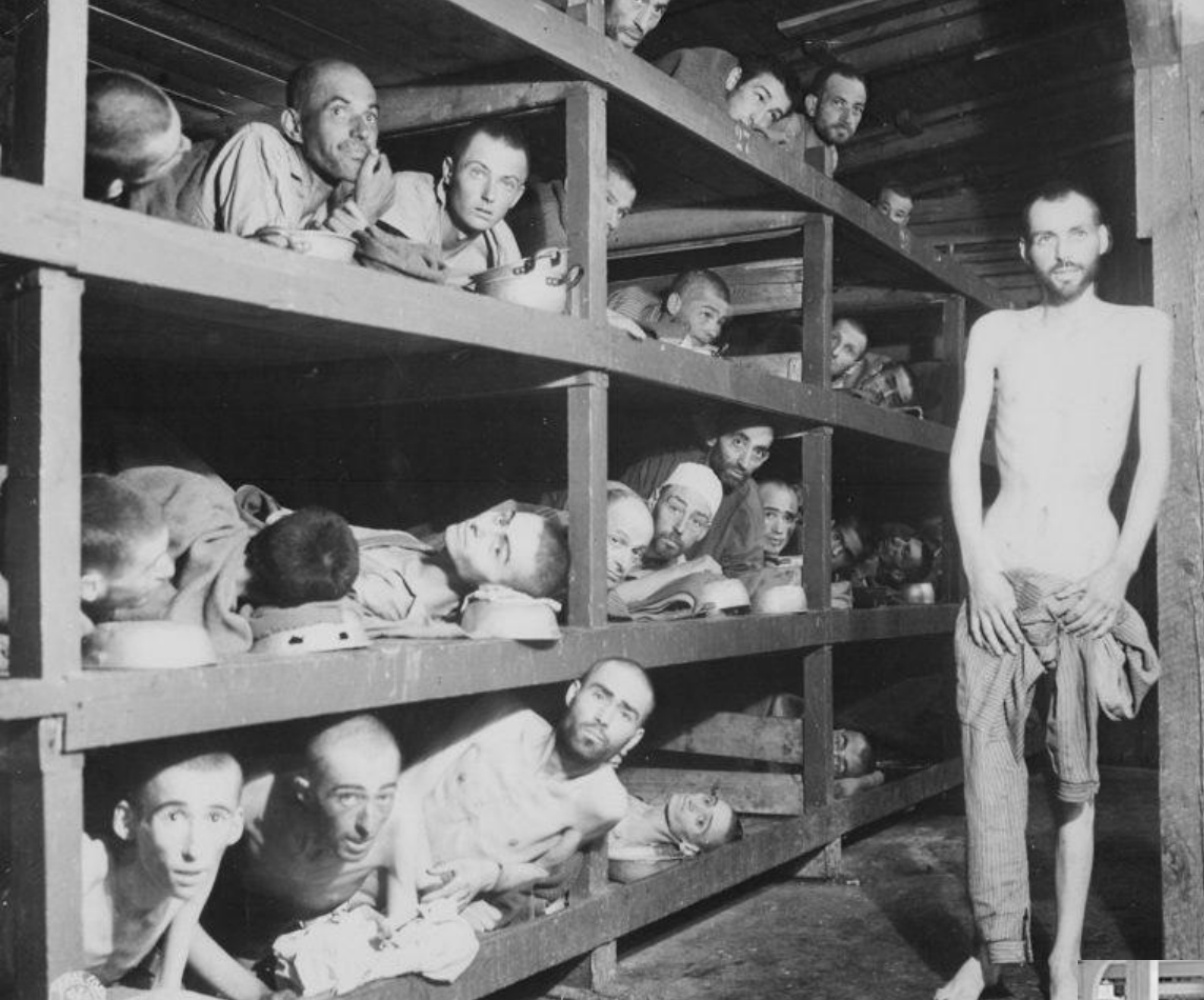
Заклученные в бараках