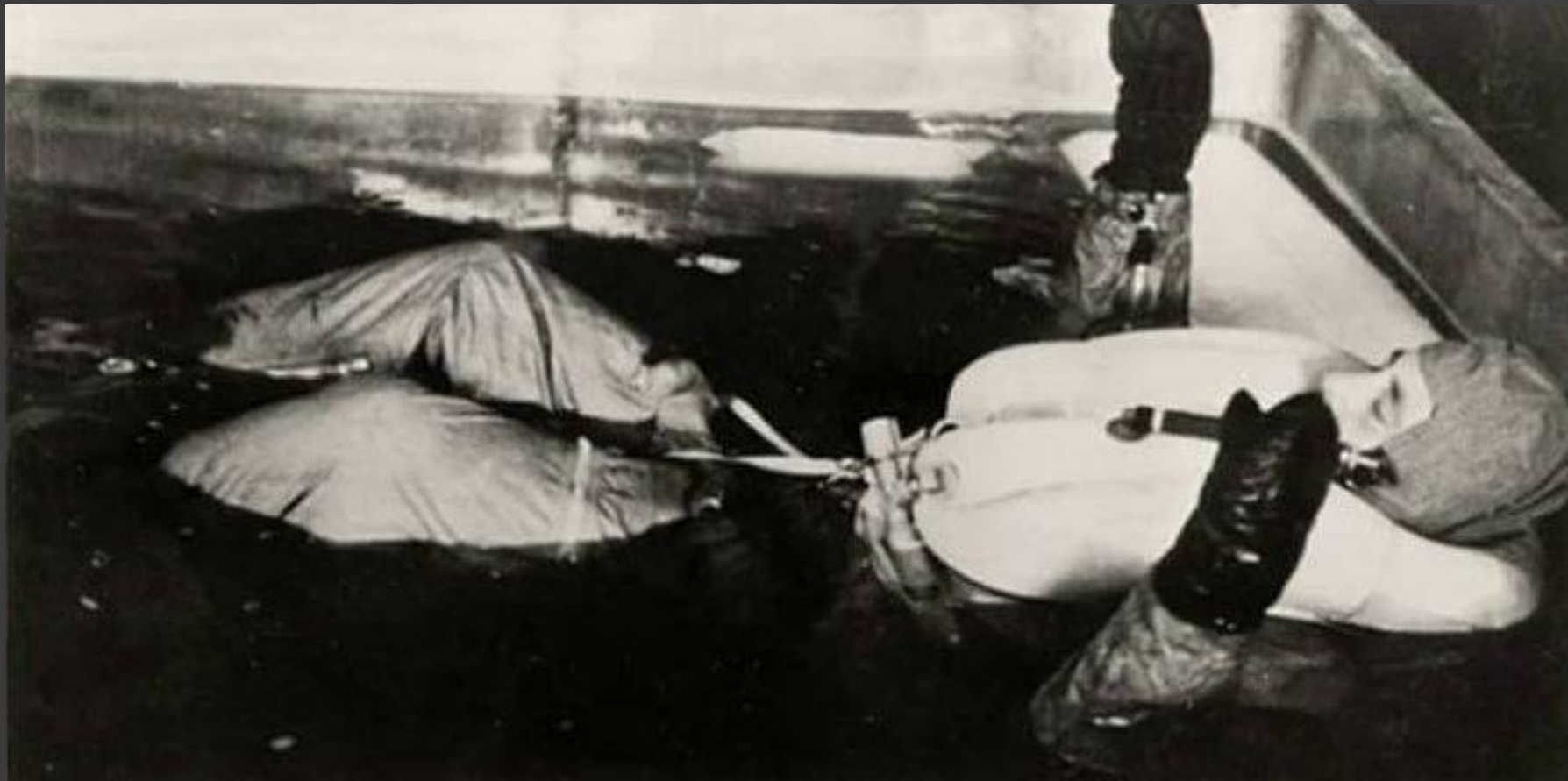
Погружение в холодную воду. Узник одет в экспериментальную форму Люфтваффе