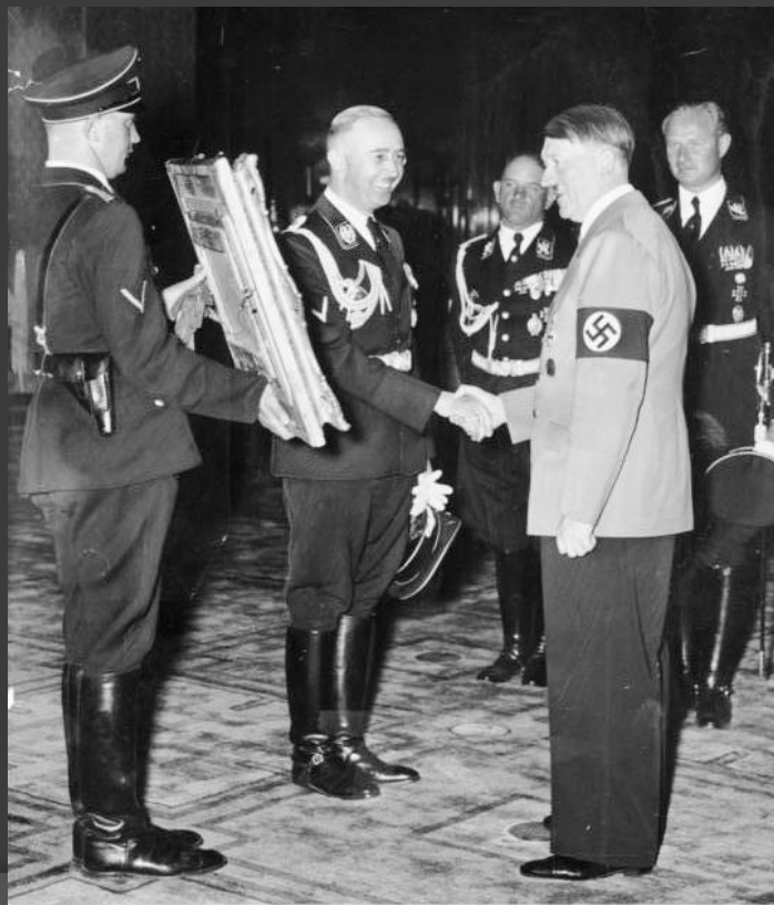
На др у Гитлера

Место под будущий концлагерь выбирал лично Генрих Гиммлер, на то время — начальник полиции Мюнхена