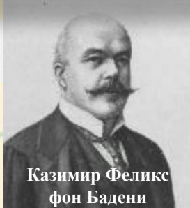
Казимир Феликс фон Бадени

Для снижения остроты национальных противоречий правительство демократизировало избирательное право