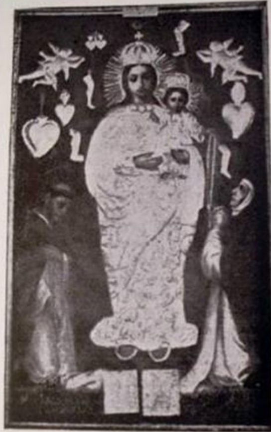
CUDOWNY OBRAZ MATKI BOSKIEJ RÓŻAŃCOWEJ, ZNAJDUJĄCY SIĘ W KOŚCIELE GRAUŻYSKIM

Królowo Różańca świętego módl się za nami. Abyśmy się stali godnymi obietnic Chrystusowych.