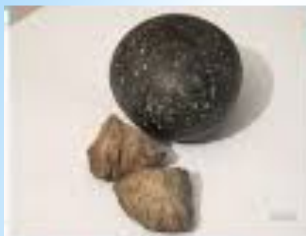
МЯЧ ИЗ КАМНЯ