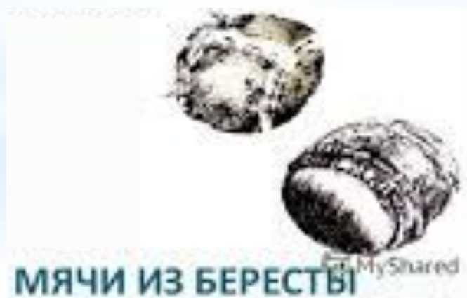
МЯЧИ ИЗ БЕРЕСТЫ