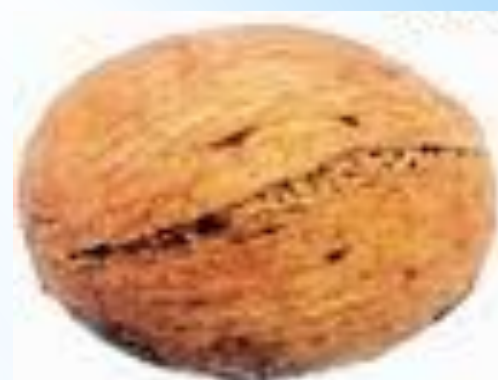
МЯЧ ИЗ ТРАВЫ