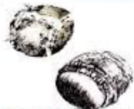
МЯЧИ ИЗ БЕРЕСТЫ