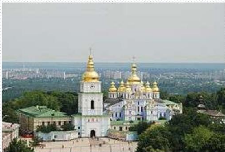
Михайлівський Золотоверхий собор, 12 століття