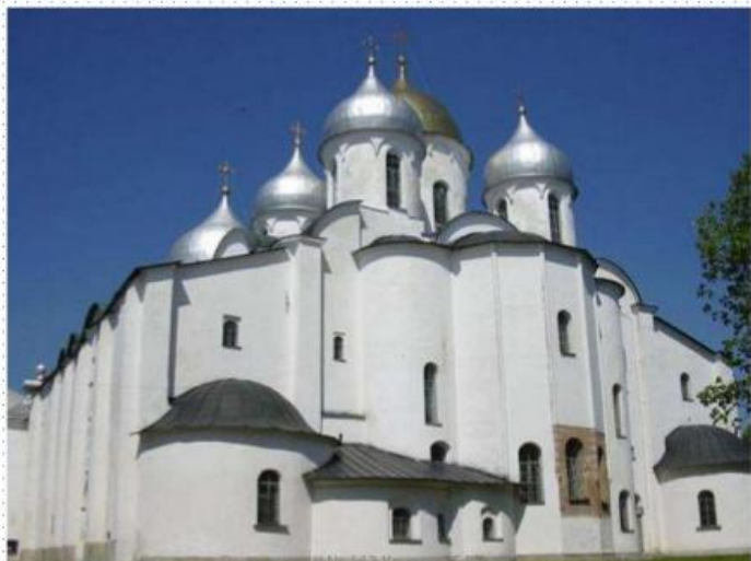
Софіївський собор у Новгороді