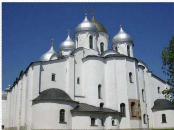
Софіївський собор у Новгороді