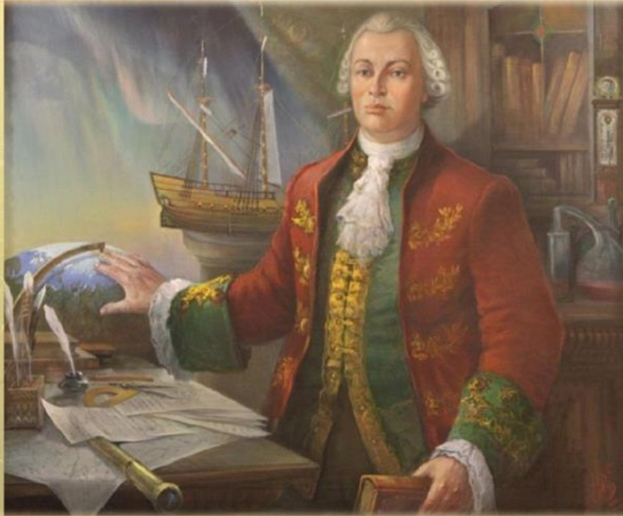
Миха́йл Васи́льевич Ломоно́сов

Примечательно, что университет так и не стал нормально функционировать в Петербурге в XVIII в. , даже несмотря на усилия М. В. Ломоносова, но прижился в Москве, где до того уже десятилетия работала Славяно-греко-латинская академия.