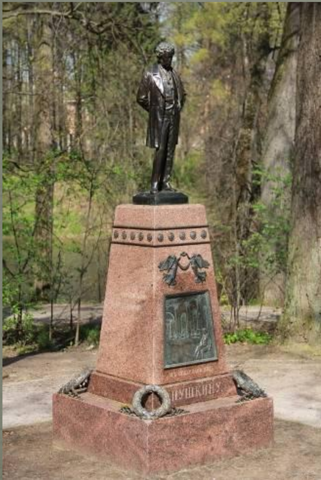
Памятник А.С. Пушкину