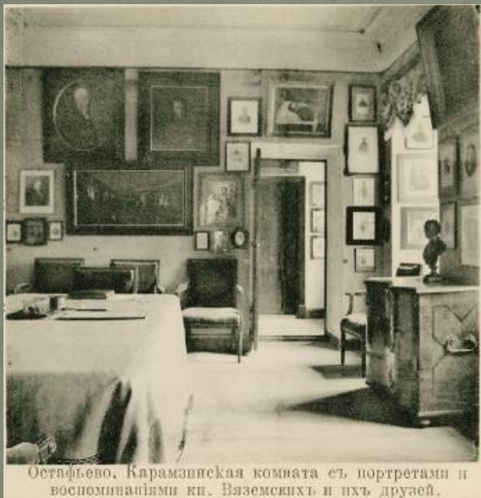
Рабочий кабинет Н.М. Карамзина