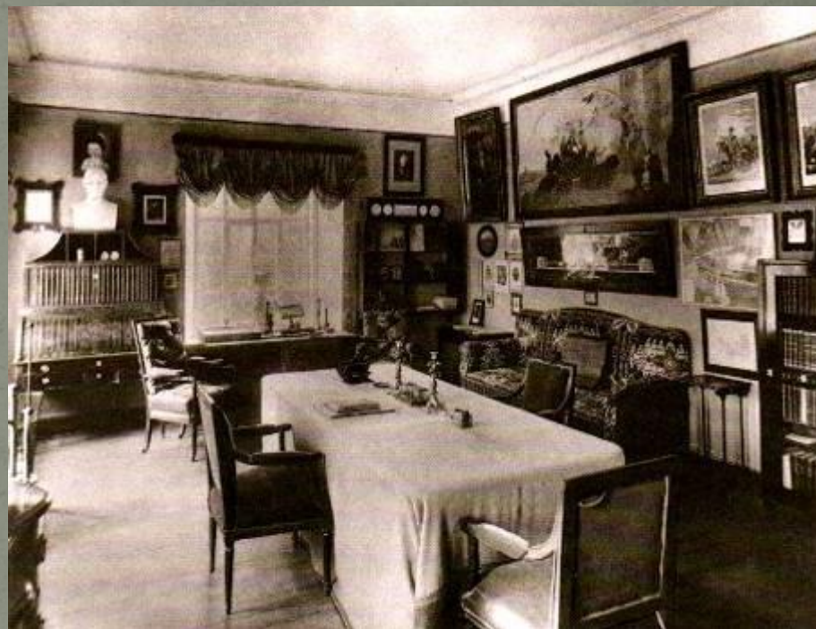
Павел Петрович создал в Остафьево мемориальную комнату своего отца Петра Андреевича Вяземского.