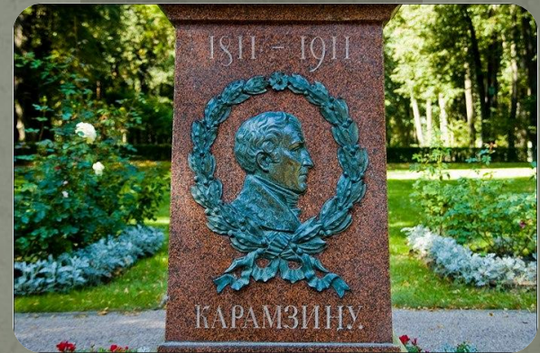
Памятник Н.М. Карамзину 1911 г.