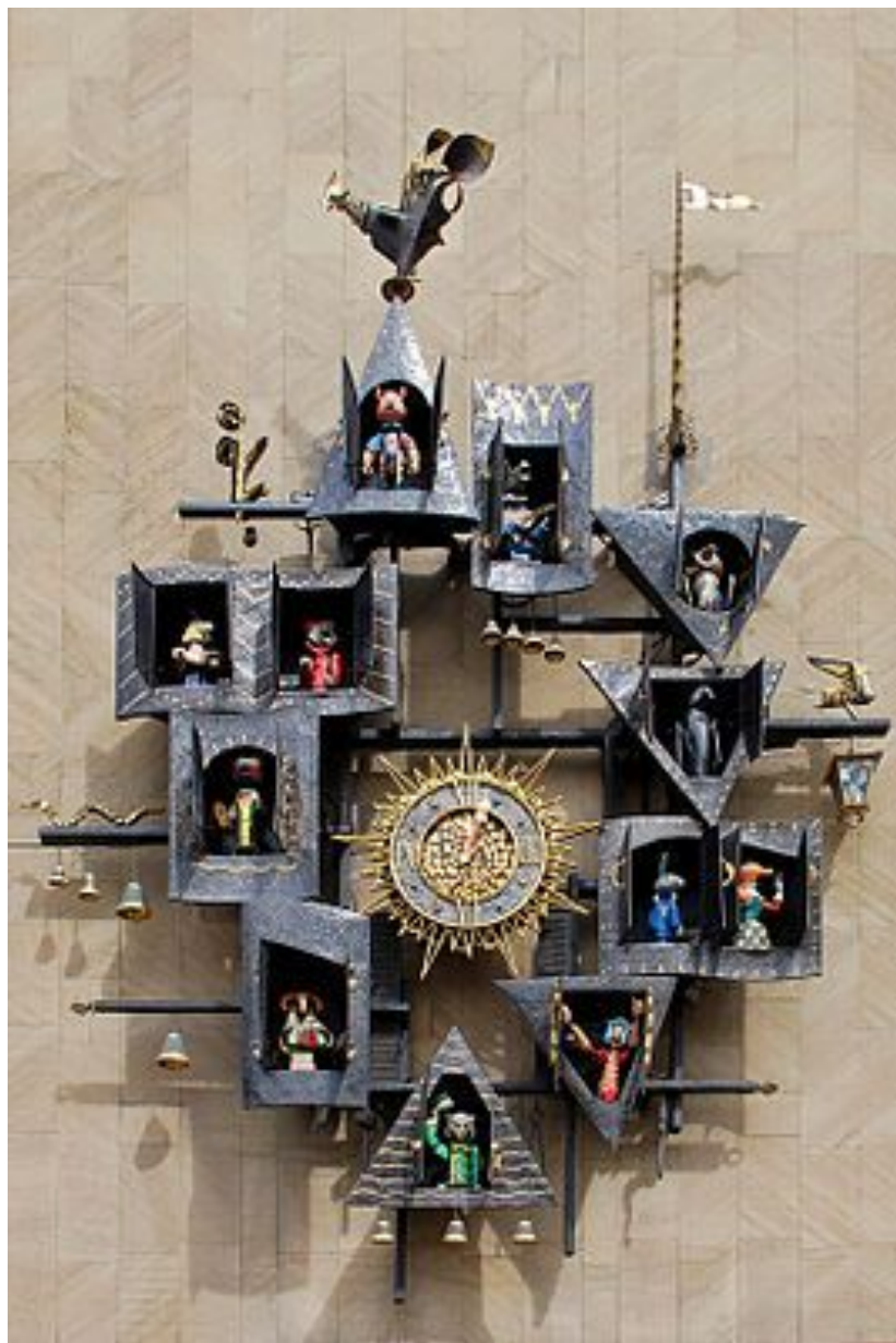
Часы на фасаде ГЦАТК , 2009г.