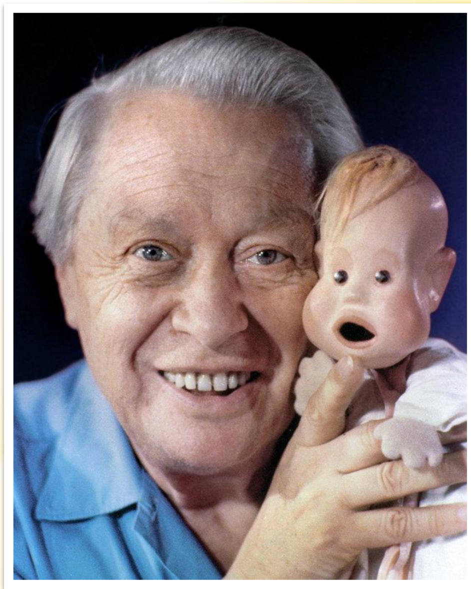
Сергей Владимирович Образцов (1901-1992гг.)