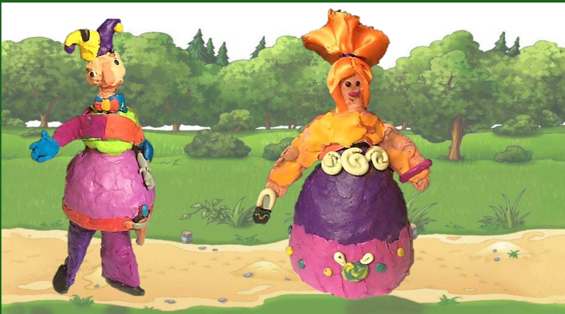
По дороге на ярмарку