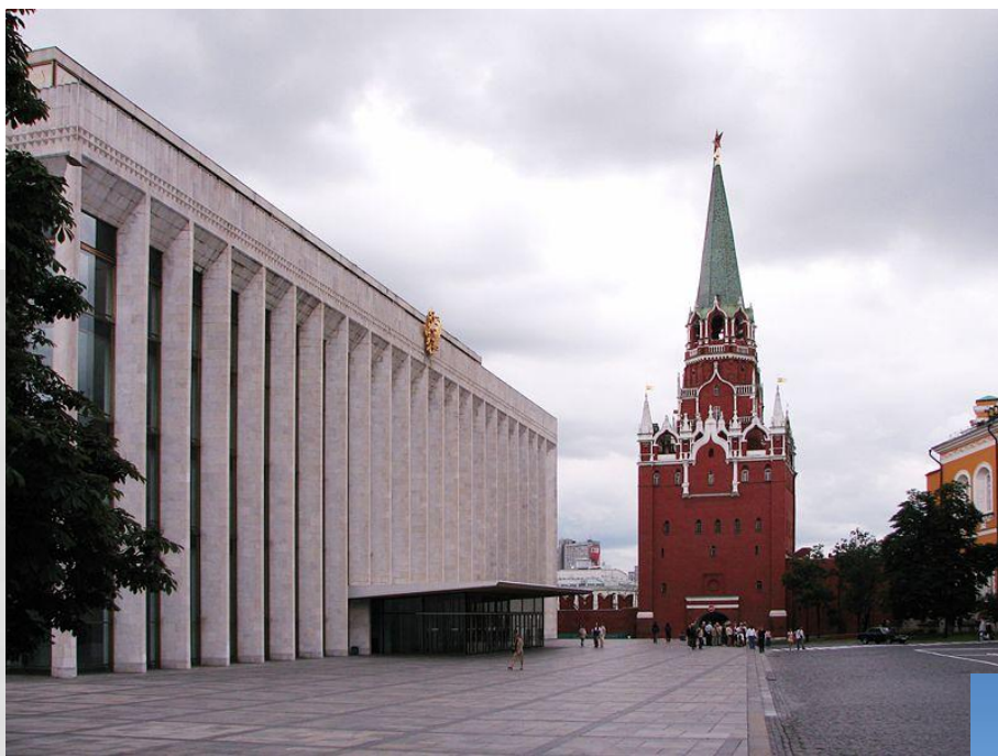
Дворец съездов в Кремле