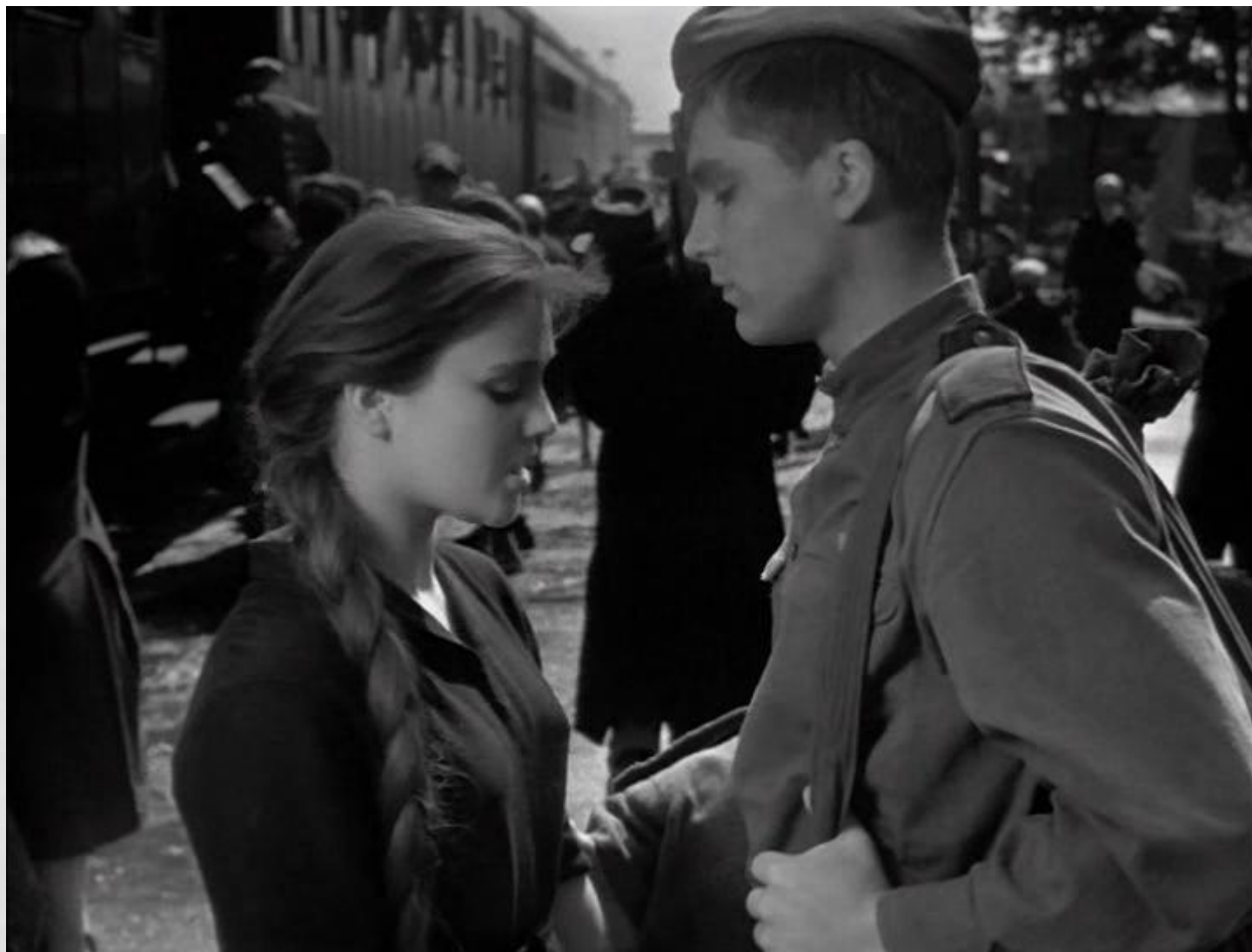
«Баллада о солдате»