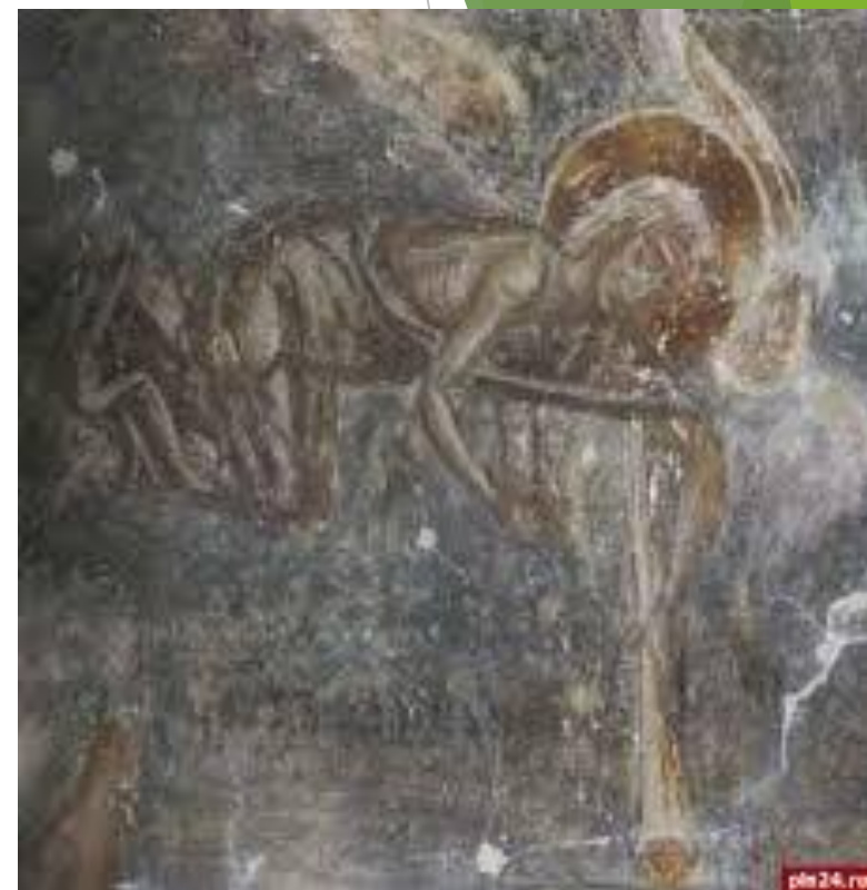
Фрески собора Рождества Богородицы Светогорского монастыря