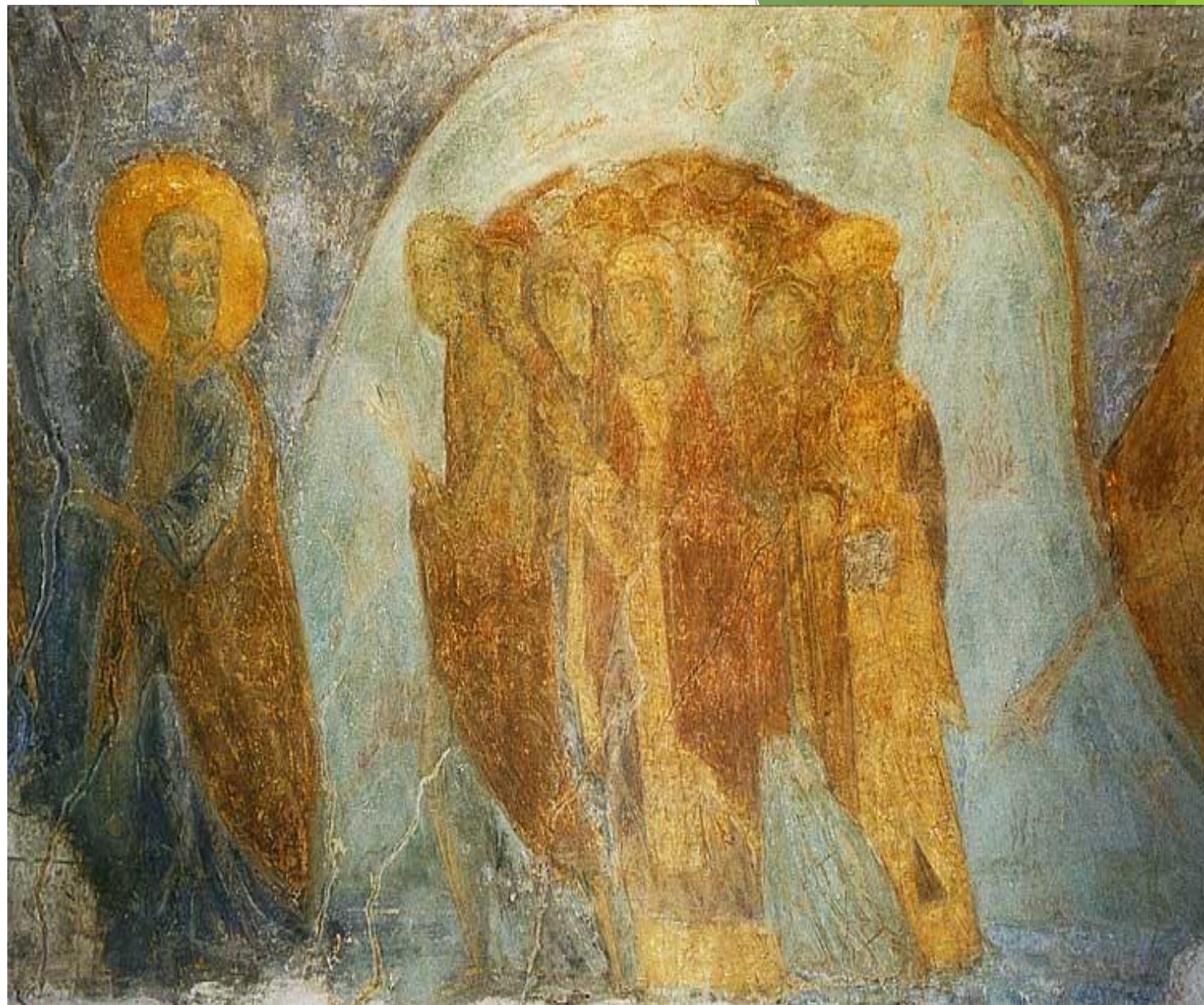
Шествие праведных в рай. Фрагмент фрески Дмитриевского собора.