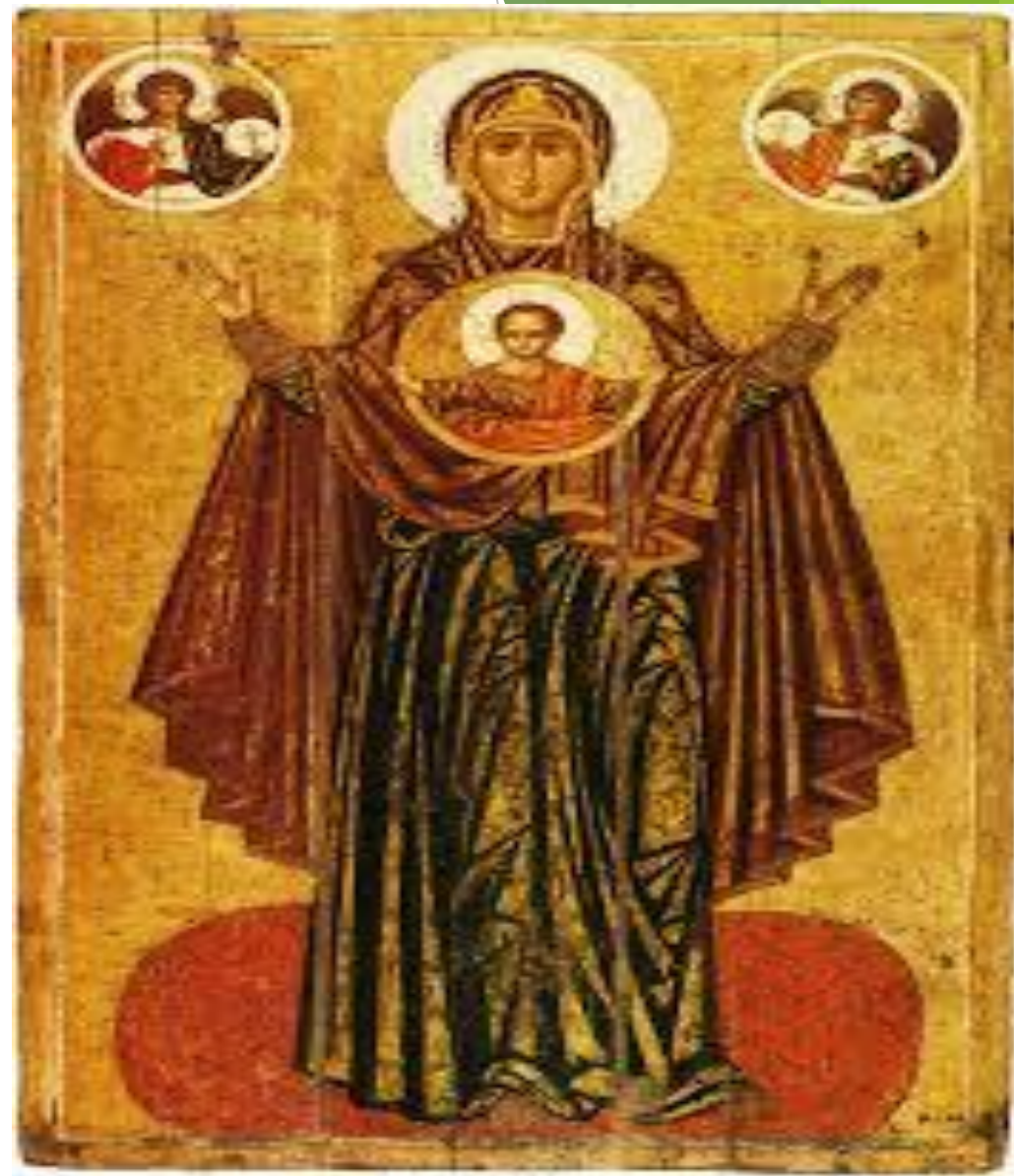
Ярославская Оранта. (Богоматерь Великая Панагия). Первая половина XIII

Новые мотивы родились и в воплощении Богоматери Оранты — Великой Панагии, где, как считают ученые, наметилось изображение, позднее получившее название «Покров» (Богородица-заступница простирает руки над русской землей, беря ее под свое покровительство).