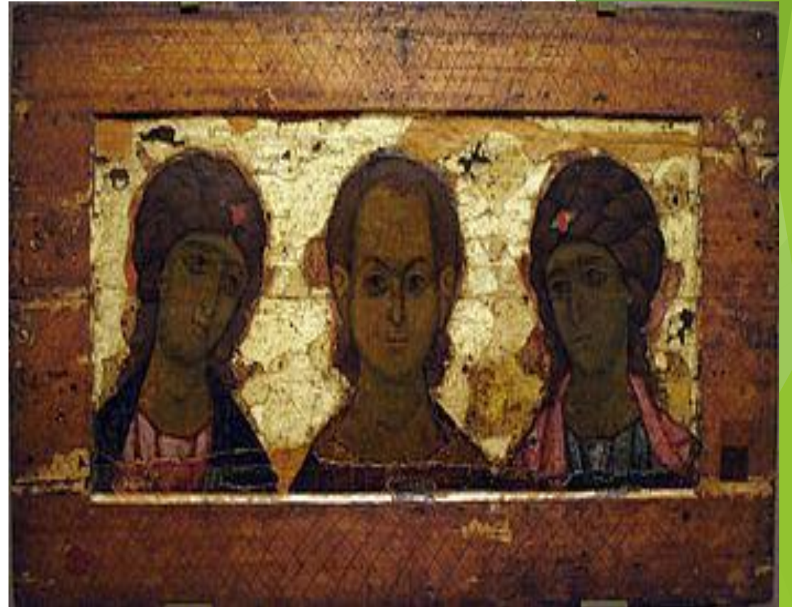
Деисус. Архангел Михаил, Спас Иммануил, архангел Гавриил. Сер. XII в.