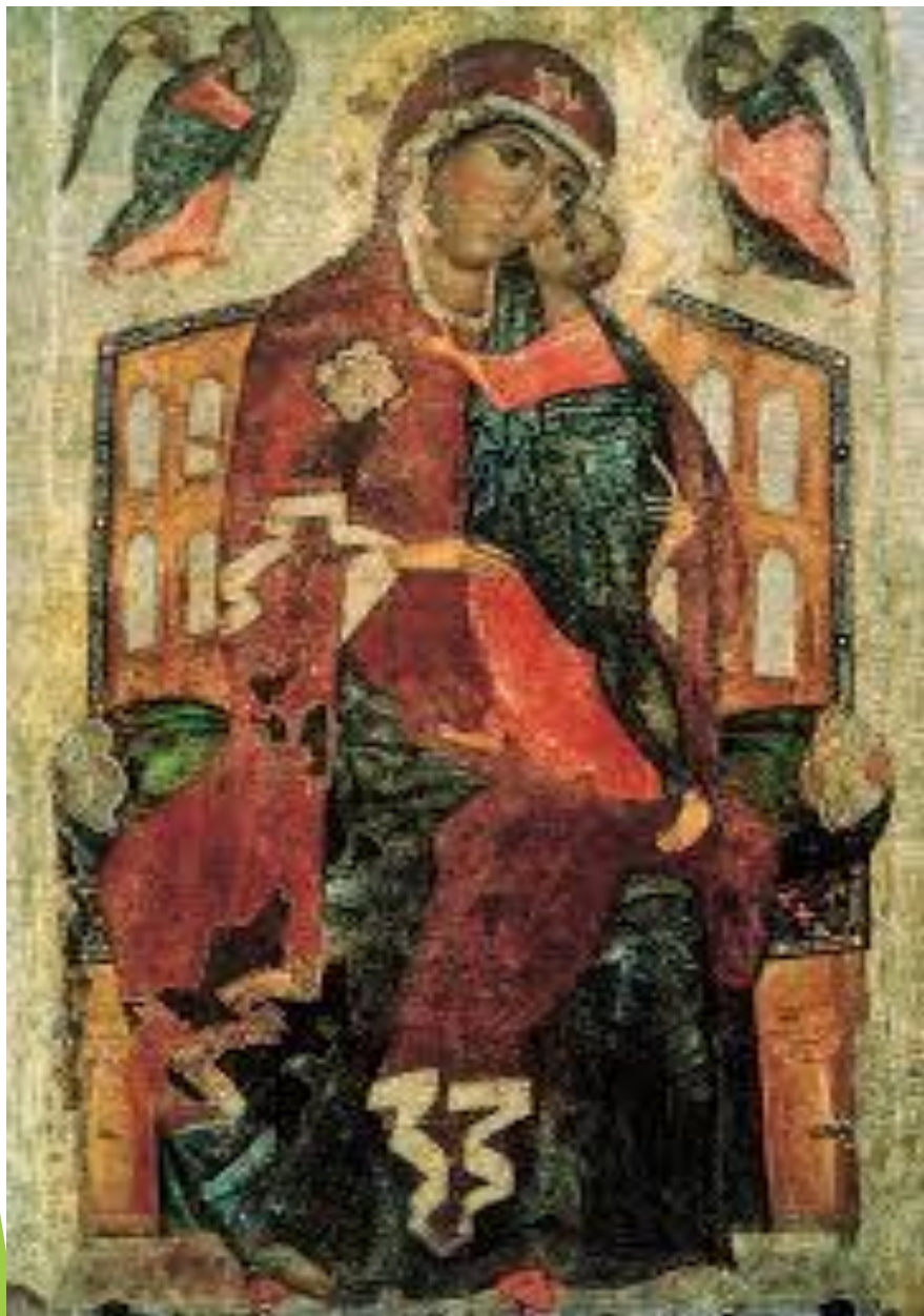
Толгская богоматерь. Ярославская школа. Конец XIII в.