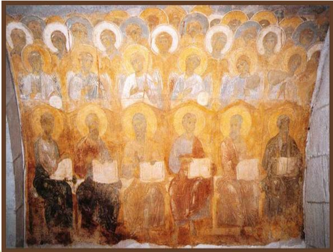
Ангелы. Фрагмент фрески «Страшный суд» Дмитриевского собора во Владимире. XII в.

О ее началах говорят сохранившиеся фрагменты фресок Дмитриевского храма и немногочисленные дошедшие до нас иконы. Переработав наследие киевских учителей, владими́ро-суздальские мастера создали собственный художественный язык, в котором изящество формы сочеталось с красочной нарядностью.