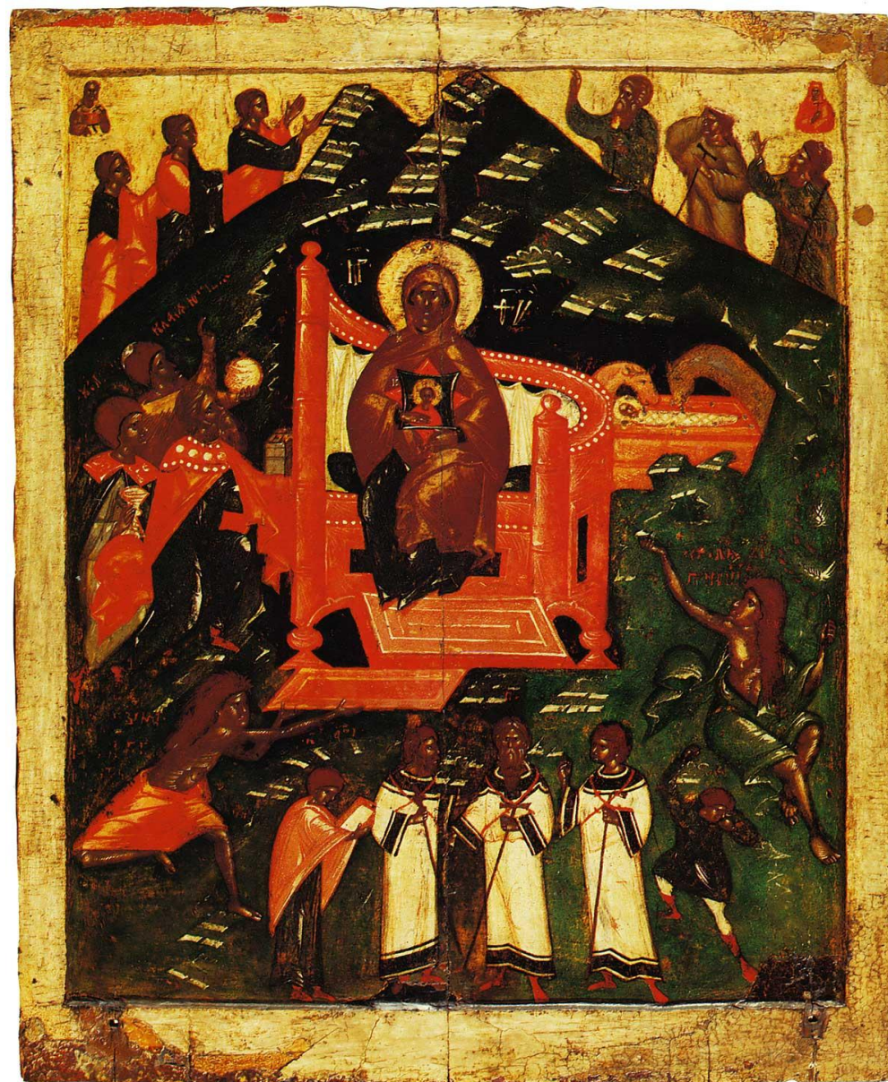
Икона "Собор Богоматери" из псковской Варваринской церкви. Конец XIV- нач. XV в. Псков.

Псковская живопись отличается не меньшей оригинальностью и почвенностью, нежели творения владими́ро-суздальских мастеров. Драматизм и повышенная эмоциональность являются одной из важнейших примет псковской иконописи. Такова икона «Собор Богоматери», где в сравнительно новом для русской живописи сюжете художник сумел передать его сложную символику.