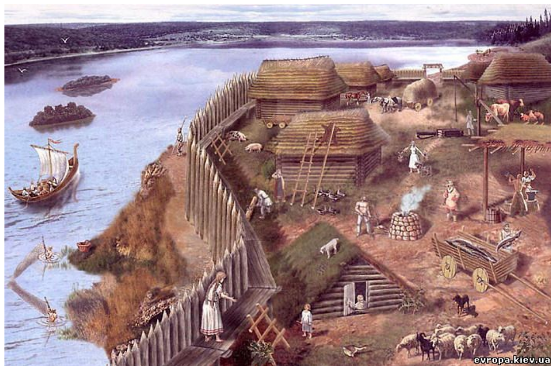
Посёлок древних славян