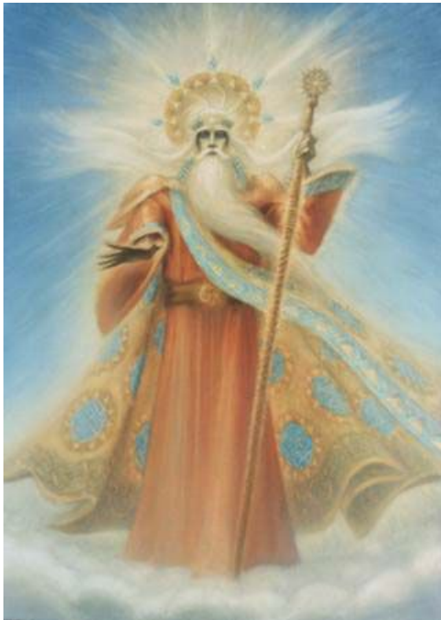
Сварог бог неба