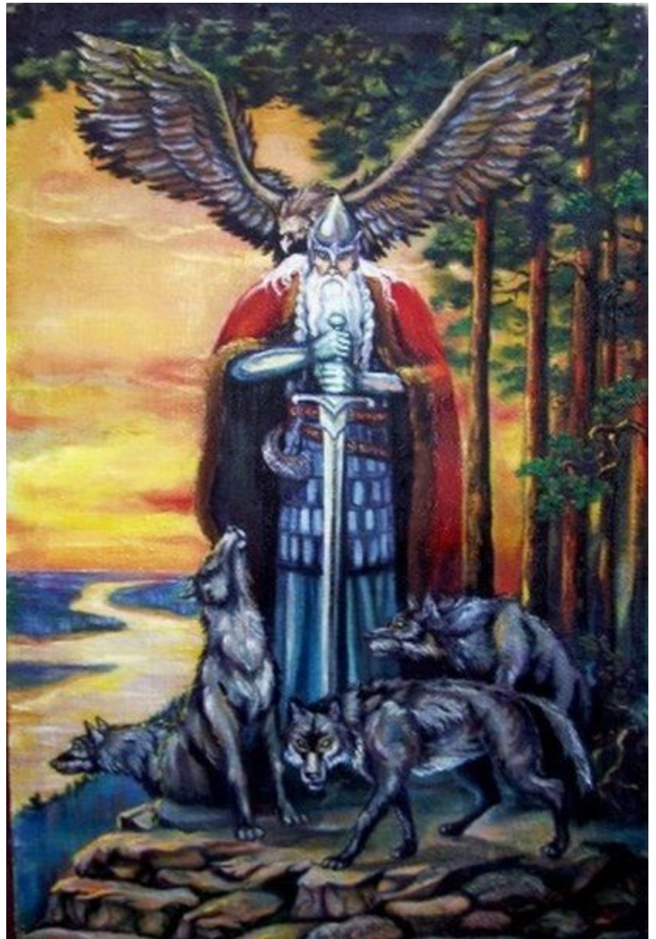
Перун - бог грома и молнии