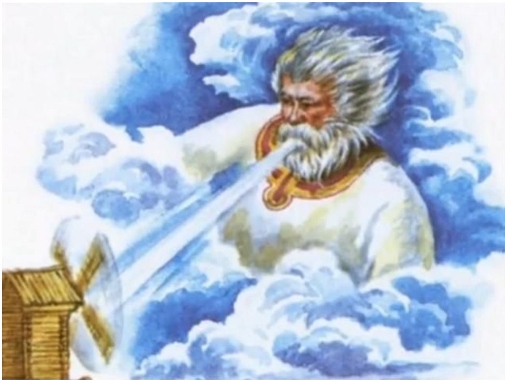
Стрибог – бог ветра