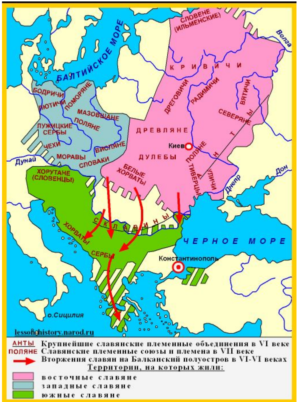
Размещение славянских племен