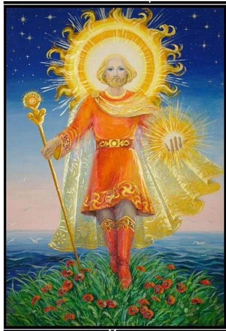
Ярило – бог солнца