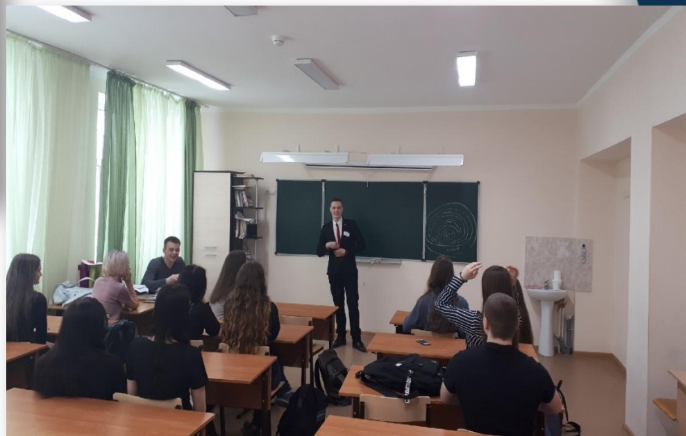
Встреча в ГБОУ СОШ № 8