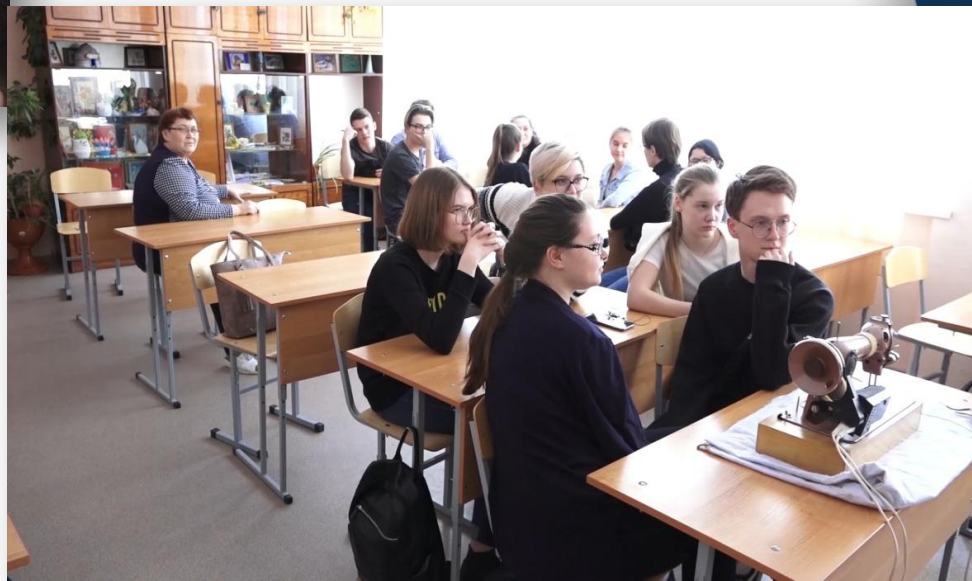
Встреча в ГБОУ СОШ № 6