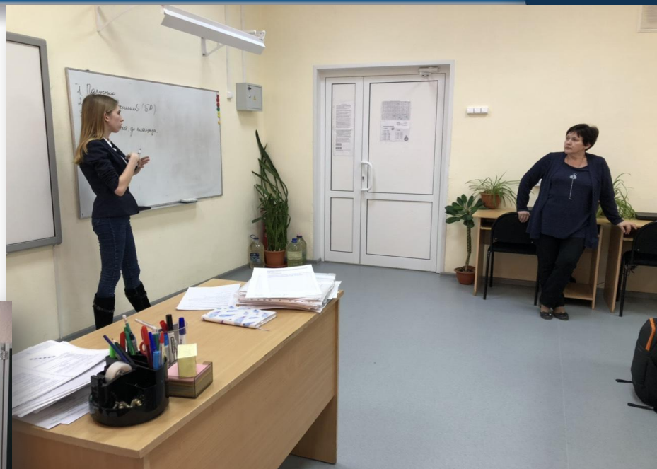
Встреча в ГБОУ СОШ № 13