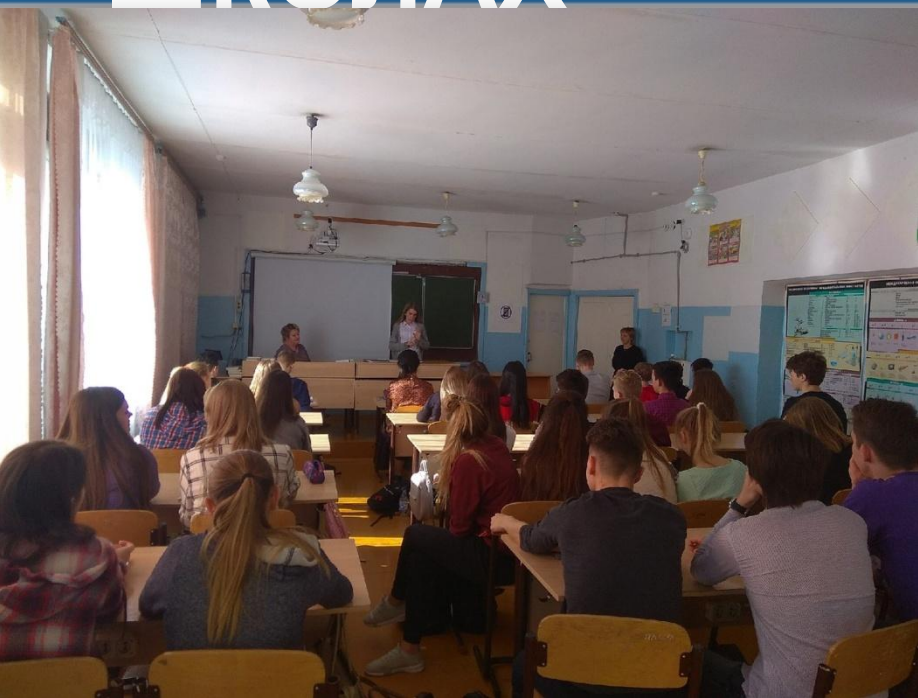
Встреча в ГБОУ СОШ № 14