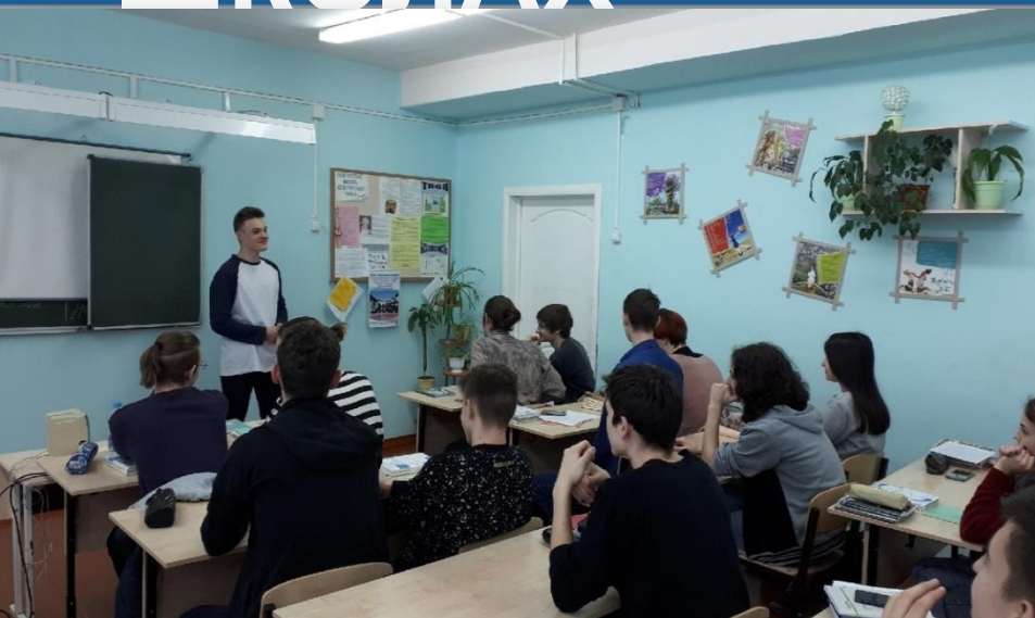
Встреча в ГБОУ СОШ № 10