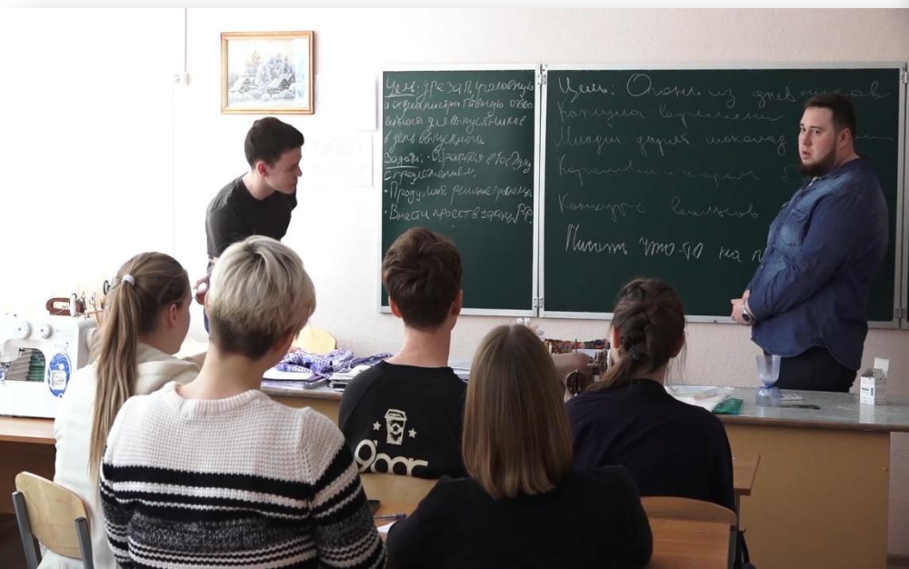
Встреча в ГБОУ СОШ № 6