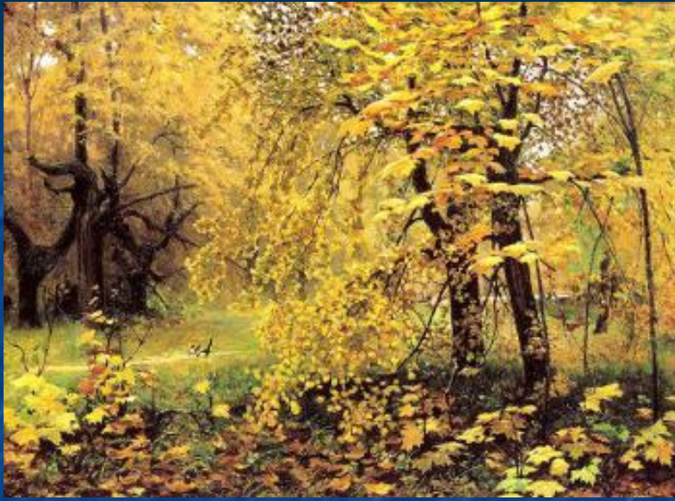
И. С. Остроухов "Золотая осень"

Какого цвета осень? Что объединяет эти картины?