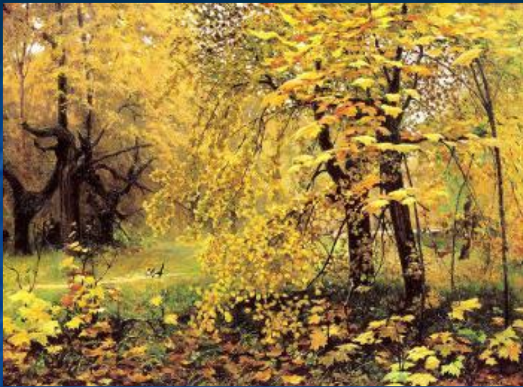
И. С. Остроухов "Золотая осень"

Какого цвета осень? Что объединяет эти картины?