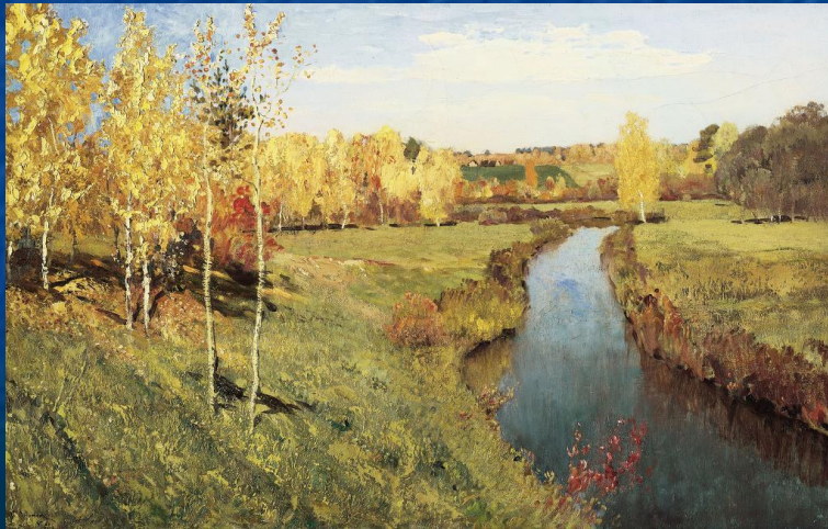
И. Левитан "Золотая осень"