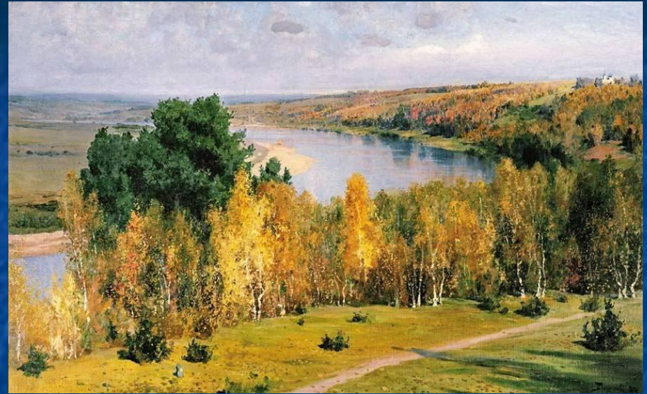
В. Поленов "Золотая осень"