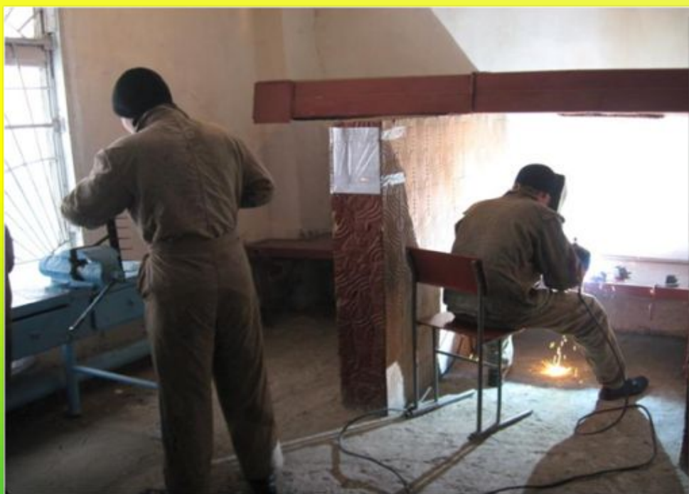
Сварщик (электросварочные и газосварочные работы)