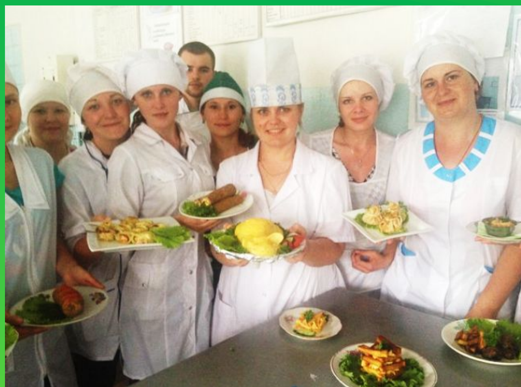
Поварское и кондитерское дело

Среднее профессиональное образование по самым востребованным профессиям и специальностям