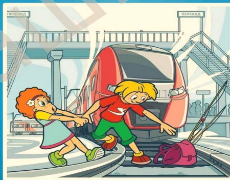
Нельзя переходить пути в неполюженном месте