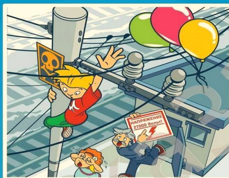
Приблизиться к проводам меньше чем за 2 метра - смертельно опасно!