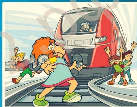
Наушники и железная дорога - не совместимы!