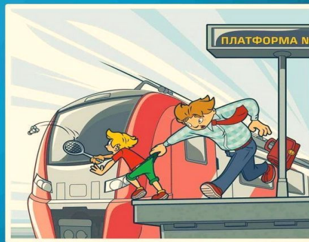
Платформа - не место для игр!