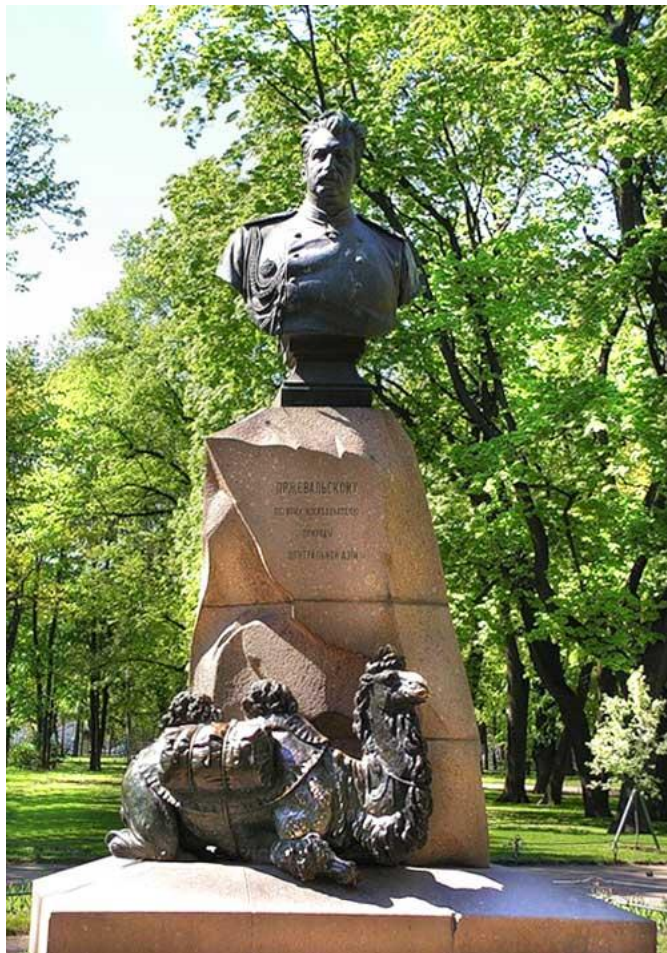
Николай Михайлович Brown Пржевальский