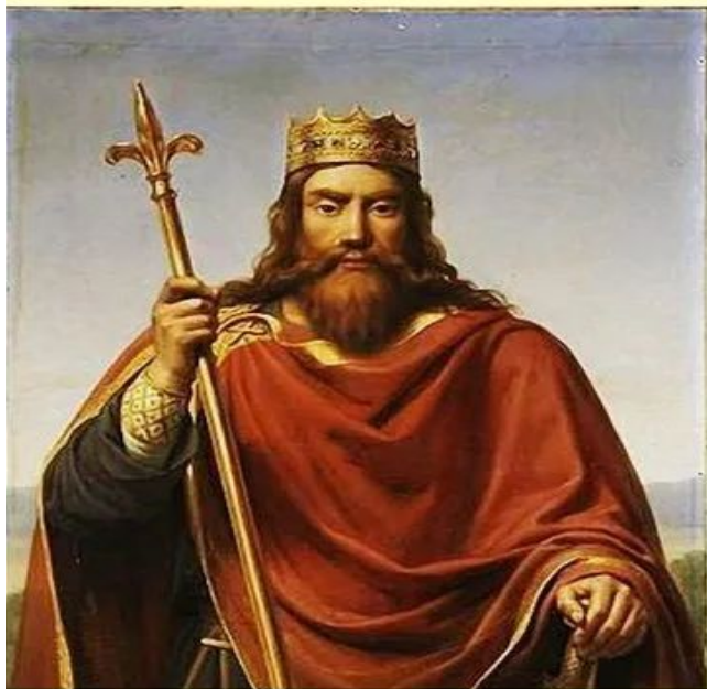
Хлодвиг I король франков. Худ. Франсуа Луи Дежюин. Версаль.

У франков уже выделилась знать и появились военные вожди.