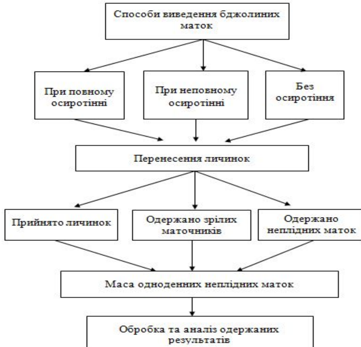
Рис. 1. Схема проведення досліджень