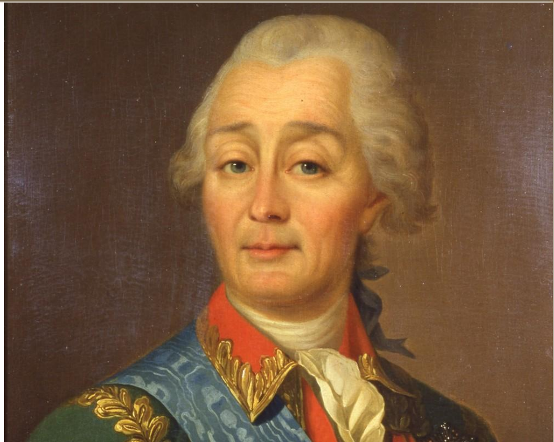
Суворов Василий Иванович