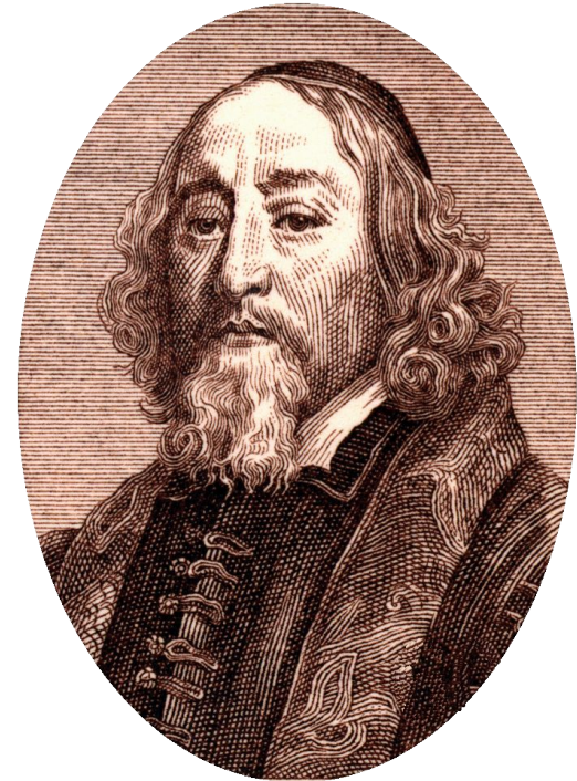
Ян Амос Коменский