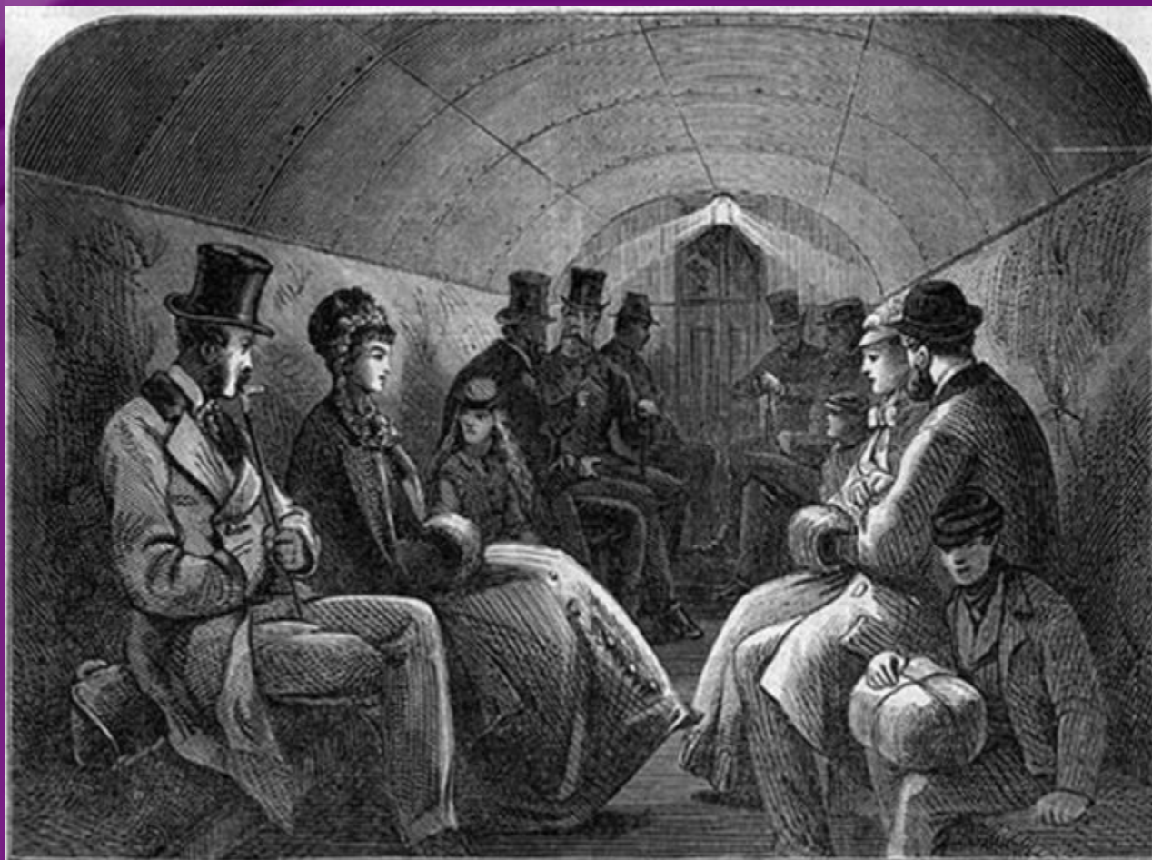
Лондонское метро XIX века