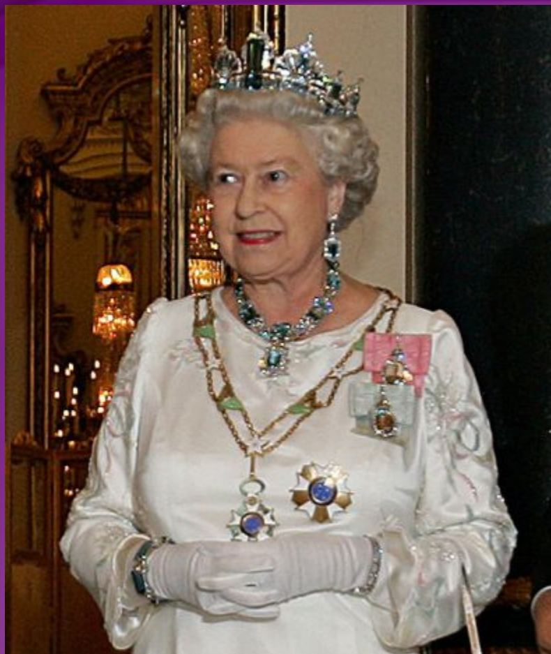
Королева Елизавета II