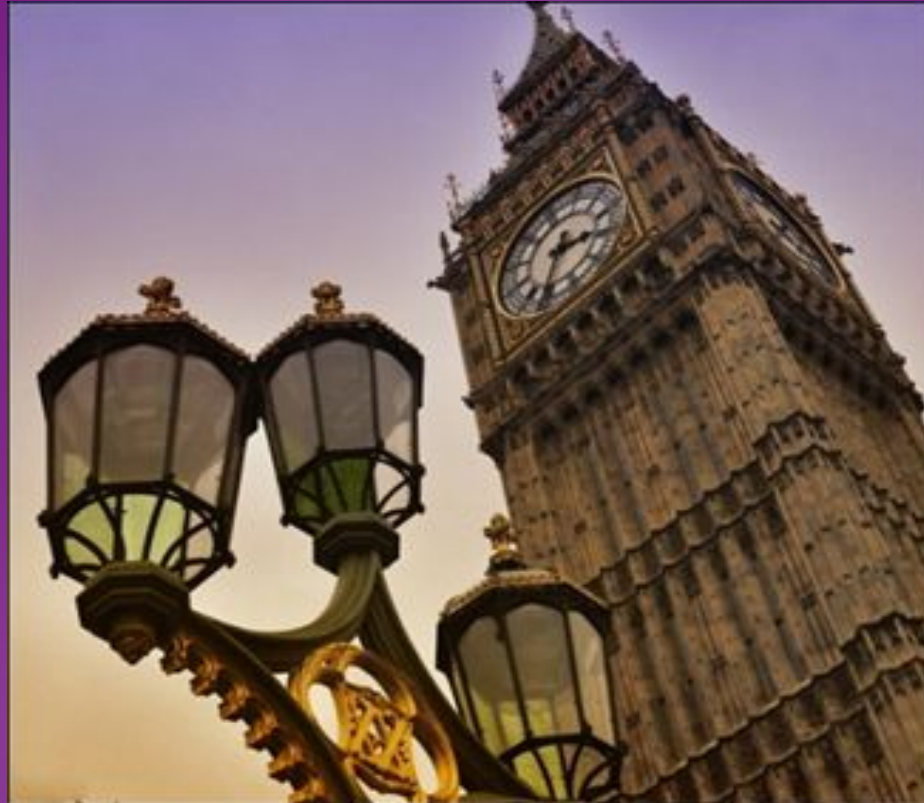
Биг - Бен