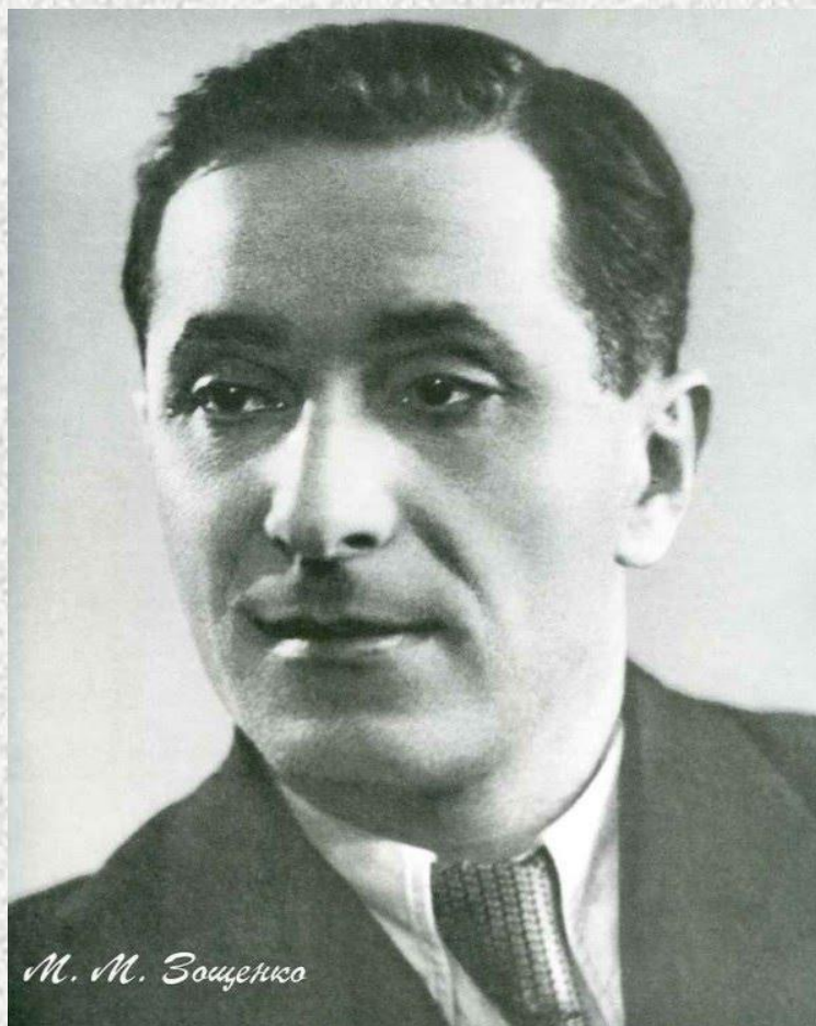
М. М. Зощенко