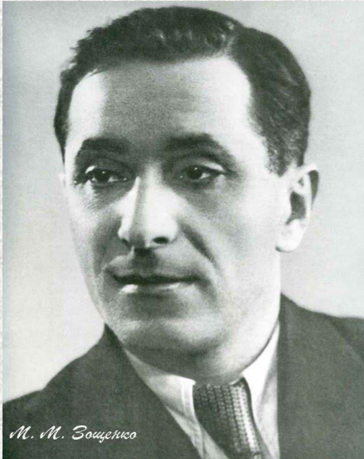
М. М. Зощенко