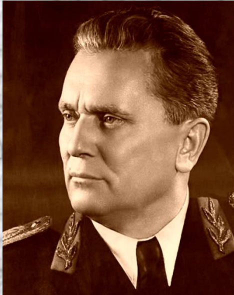
И. Броз Тито