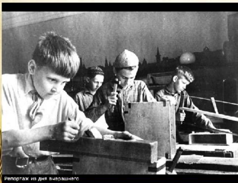
Репортаж из дня вчерашнего

Смертельная угроза нависла над нашей Родиной. Все, кто мог воевать, пошли на фронт. Остальные помогали армии в тылу, обеспечивая её продовольствием, снаряжением и боеприпасами.