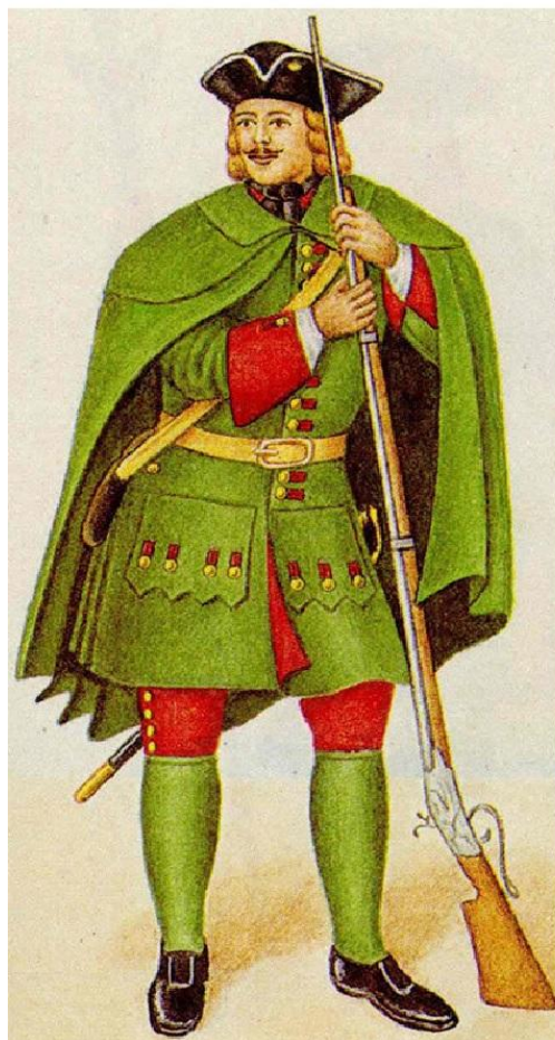
Шинель 1799 г.