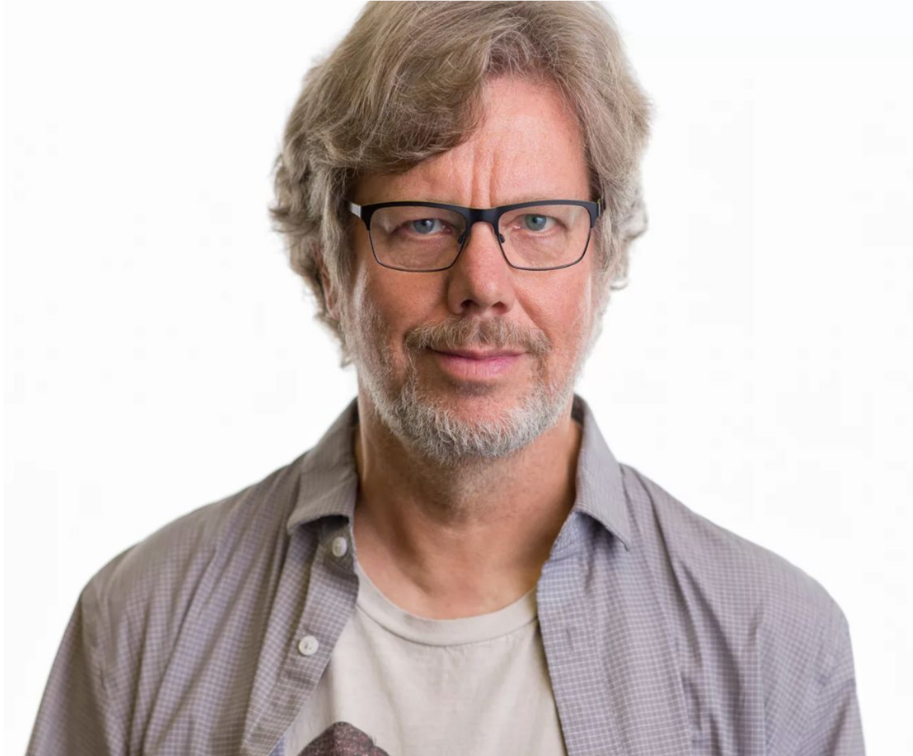
Гвидо ван Россум