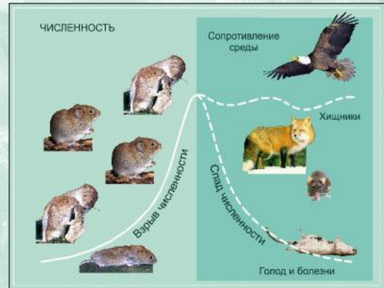
Факторы, влияющие на численность грызунов.

Плотность жизни определяется размерами организмов и необходимой для их жизни площадью. Например, слону для нормального существования необходима площадь в 30 км 2 , пчеле - 200 м 2 , травянистым растениям - 30 см 2 .